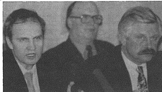
حتی روتسکوی معاون رئیس جمهور (سمت راست) و زورکین رئیس دادگاه قانون اساسی روسیه (سمت چپ) نیز خودکامگی های یلتسین را نمی پذیرند.

هنگامی که این شماره نشریه زیر چاپ می رفت، هنوز نتایج referendum ۲۵ آوریل روسیه اعلام نشده بود. با این حال حتی بدون آگاهی از نتایج این همه پرسی، می توان گفت که به احتمال قریب به یقین، این رای گیری هیچ یک از مشکلاتی را که روسیه با آن دست و پنجه نرم می کند، حل نخواهد کرد. هفته گذشته، دادگاه قانون اساسی روسیه باز هم در دهوی میان یلتسین و پارلمان به روال همیشگی خود، موضعی میانه اتخاذ کرد. مسئله بر سر این بود که آیا در referendum روسیه اکثریت رای دهندگان تعیین کننده است یا اکثریت واجدین شرایط. سوالهای referendum از این قرار تعیین شده اند: