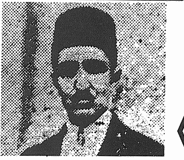
محمد دهگان، از پیشگامان برجسته جنبش سندیکایی، رهبر اتحادیه مرکزی کارگران ایران در بین الملل سندیکای کارگری.