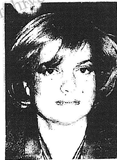
یک سیاستمدار زن ریاست دولت ترکیه را بر عهده میگیرد

عملیات مجدد ارتش ترکیه علیه کردها در حالی صورت میگیرد که پ. کا. کا. از چند ماه پیش با اعلام آتش بس یکجانبه، خواهان حل مسالمت آمیز مسئله کردستان ترکیه شده است.