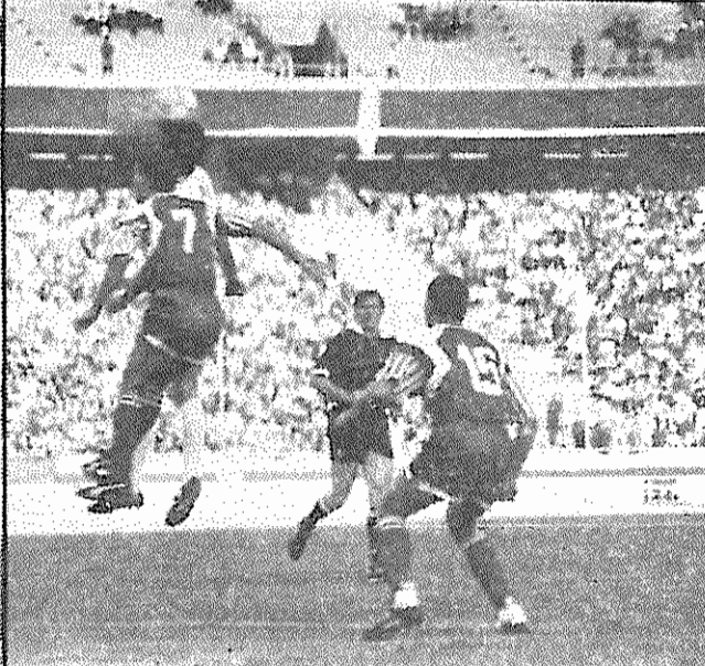
صحنه ای از پیکار تیم ملی ایران و سوریه

انتظام: آدرس ندارم چون شما همه چیز را نابود کردید، ولی تلفن منزل دختر عمه ام را دارم. مخاطب: اگر آزاد شوید چه خواهید کرد؟ انتظام: آزاد نمی شوم و تا تجدید محاکمه و اعاده حیثیت در زندان می مانم. مخاطب: اگر مطابق میل خودتان از زندان رفتید، چطور؟ انتظام: آن مربوط به آینده است و اینکه چه خواهم کرد، بشما ارتباطی ندارد و شما حق ندارید به تفتیش عقیده من بپردازید. اقلًا به قانون اساسی خودتان احترام بگذارید. مخاطب: آیا از اعمال و کارهای خودتان توبه می کنید و متنبه هستید؟ انتظام: کارشرافتمندانه افتخار دارد و قابل توبه کردن نیست. کسانی باید توبه کنند که این اتهامات سرا با کذب و نامربوط را ساختند و این رای ظالمانه و غیر انسانی را صادر کردند. مخاطب: آیا مطلبی برای گفتن دارید؟ انتظام: با شما نه. مخاطب: مقصودم، انتقاد و ایراد، نسبت به کارهای جمهوری اسلامی. انتظام: بله، سخنی بسیار دارم، ولی نظام جمهوری اسلامی غیر قابل اصلاح است و حرف زدن بی فایده. مخاطب: در کدام زندانها بوده اید؟ انتظام: اوین، قزل حصار و گهر دشت. مخاطب: دیگر سوالی ندارم، در سالی منتظر باشید و به آموزشگاه نروید تا به شما اطلاع بدهم. -در سالن در حدود ۲ ساعت منتظر ماندم بعد آمد و گفت حالا می توانید بروید. عباس امیر انتظام - معاون نخست وزیر دولت موقت زندان اوین - ۳۰ آذر سال ۱۳۷۱