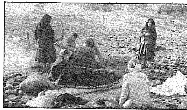
جمهوری آذربایجان است.

از سوی دیگر با ادامه این جنگ هر چه بیشتر بر امکان گسترش آن به کشورهای مجاور و در نتیجه دخالت آنان در این خونریزی بی فرجام افزوده میشود. روندی که جز پیچیدگی تر کردن اوضاع نمری دیگر نخواهد داشت.