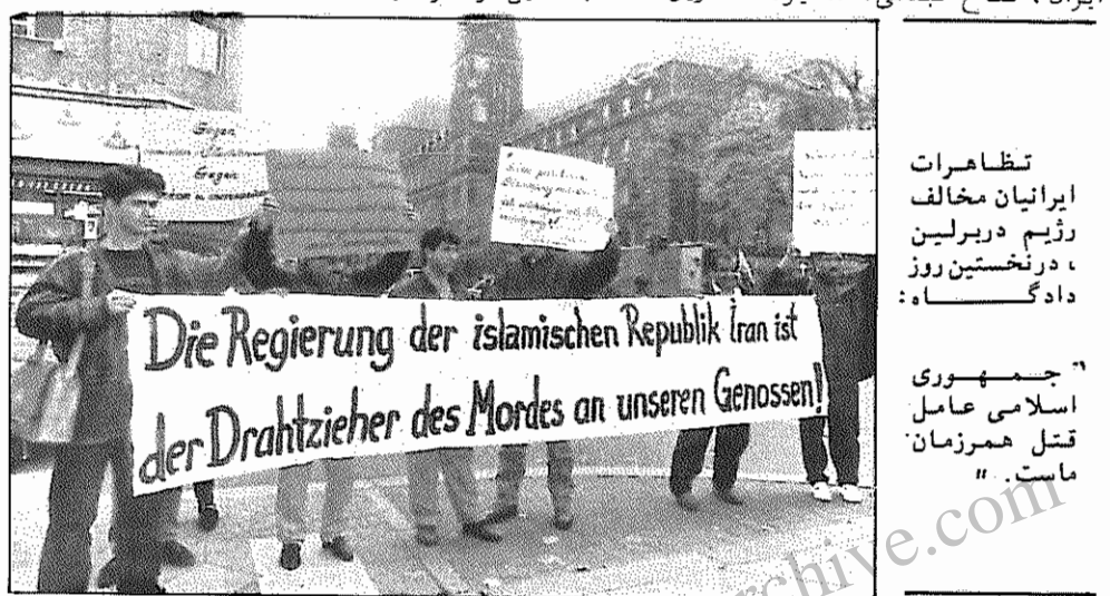
تظاهرات ایرانیان مخالف رژیم در برلین، در نخستین روز دادگاه

از ساعات اولیه با مداد روز ۲۸ اکتبر (۶ آبان) ساختمان دادگاه جنایی برلین در محاصره حدود ۲۰۰ کماندوی پلیس قرار گرفت. در ساعت ۹ صبح اولین جلسه دادگاه متهمین ترورد کتر صادق شرفکندی دبیر کل حزب دموکرات کردستان ایران، فتاح عبدلی، همایون