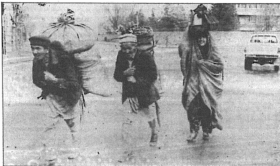
کشتار، ویرانی و آوارگی نهاد ستاورد حضور دوساله مجاهدان در کابل است

گروههای درگیر در بحران دو ساله افغانستان برای شکستن بن بست موجود در جنگ داخلی این کشور به تلاش تازه‌ای دست زده‌اند. اغلب این گروهها با شرکت در نشستی در تهران موافقت کردند. پیشنهاد چنین نشستی در اجلاس وزرای خارجه کشورهای عضو سازمان کنفرانس اسلامی در اسلام آباد پاکستان توسط ولایتی وزیر خارجه جمهوری اسلامی طرح شد. سخنگوی وزارت خارجه جمهوری اسلامی در این باره گفت: در شرایطی که همه راههای گفتگوی مستقیم به بن بست رسیده بود و تلاشهای نمایندگان سازمان ملل و سازمان کنفرانس اسلامی بی نتیجه مانده بود، پیشنهاد گفتگوی غیر مستقیم به وسیله جبهه‌های اسلامی در کمیته ویژه افغانستان طی اجلاس اخیر وزیران خارجه در اسلام آباد مطرح شد.