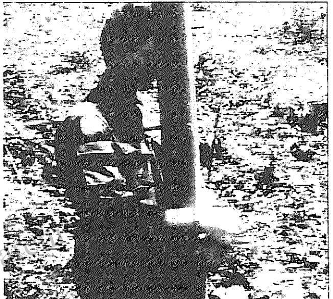
یک سرباز سازمان ملل که به دست صرب ها اسیر شده است

این حمله نه تنها به عقب نشینی صرب ها نیانجامید، بلکه آنها را