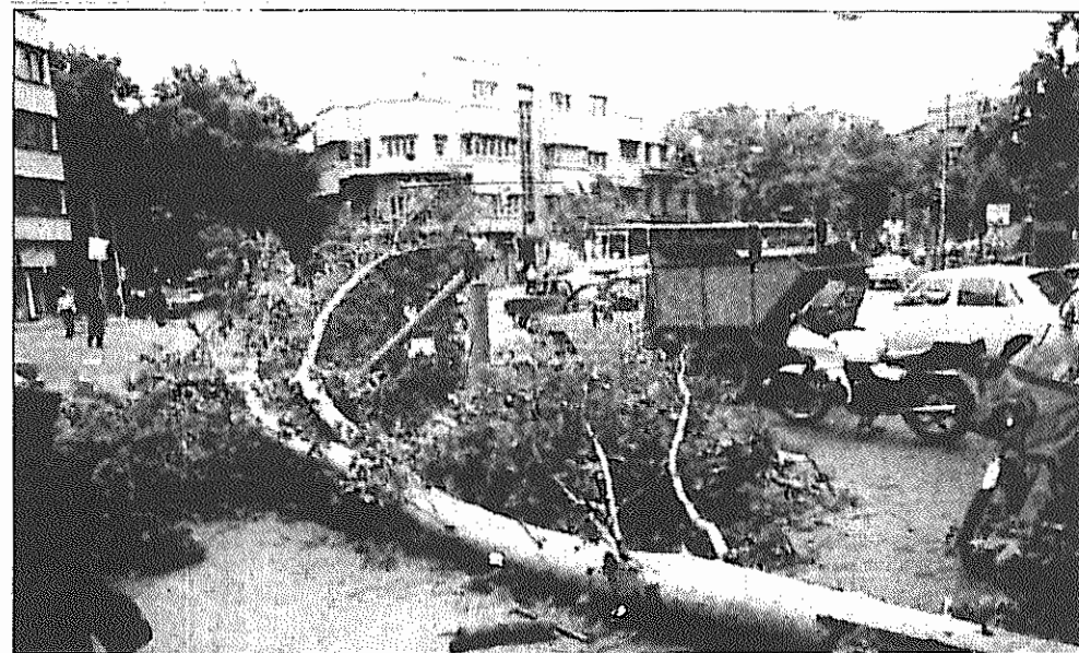
توفان و سیل در تهران درختان را از جای کند، چندین قربانی گرفت و خسارات زیادی به بار آورد

یکی از عوامل موثر در گسترش ابعاد خسارت جانی و مالی مردم مناطق سیل زده فقدان سدهای مناسب برای مهار و انحراف مسیر آب است.