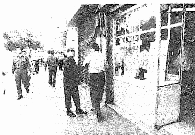
بازار آزاد ارز فعلاً دچار رکود است و صرافها و دلان منتظره؛ تأمر تصمیمات جدید دولت چقدر پاید

۶ سال پس از دوری از اقتصاد جنگی، بحران اقتصادی رفته رفته دولت و حکومت را به چنان گردابی کشاند که ناگزیر چاره کار خود را در بازگشت دوباره به اقتصاد بسته سالهای قبل دیدند. سیاست تعدیل اقتصادی در همه جهات آن، از جمله یکنان سازی نرخ ارز و شناور کردن آن و رویکرد به اقتصاد بازار ساز و کار عرضه و تقاضا، یکی پس از دیگری به کنار گذاشته شد و دولت بار دیگر کنترل امور مربوط به مبادلات ارزی و بازار گانی خارجی را به عهده گرفت. آخرین تصمیم دولت آغاز دور باطل دیگری در راهبری اقتصاد در هم شکسته ایران توسط رژیم جمهوری اسلامی است. بنابه آخرین تصمیم دولت که از روز ۱۳ اردیبهشت (۲۱ مه) به اجرا گذاشته شده است، مبادلات ارزی از این پس از طریق شبکه بانکی و بر اساس نرخ اعلام شده از سوی دولت انجام خواهد شد. نرخ تعیین شده برای هر دلار آمریکا ۳۰۰ تومان است که تا پایان سال ۷۴ ثابت خواهد ماند. خرید و فروش ارز بقیه از صفحه ۳