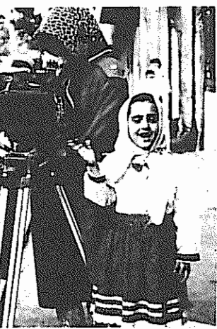
جعفر پناهی و آیلا محمد خانی دخترک فیلم که بازی درخشانی ارائه داد، سر صحنه بادکنک سفید

نگاهی امروزی و شاعرانه به مصائب جنگ می‌پردازد. صاحب نظران پس از فیلم 'روی آریزونا' که در ایالات متحده ساخته شده بود اظهار داشتند که کوستوریس با سینمای تجاری گرایش پیدا کرده است اما 'زیر زمین' وی بار دیگر به جایگاه اصلی خود بازگشته است و مسائل بنیادی و فرهنگ سرزمین ویران شده‌ی خود را می‌شناساند.