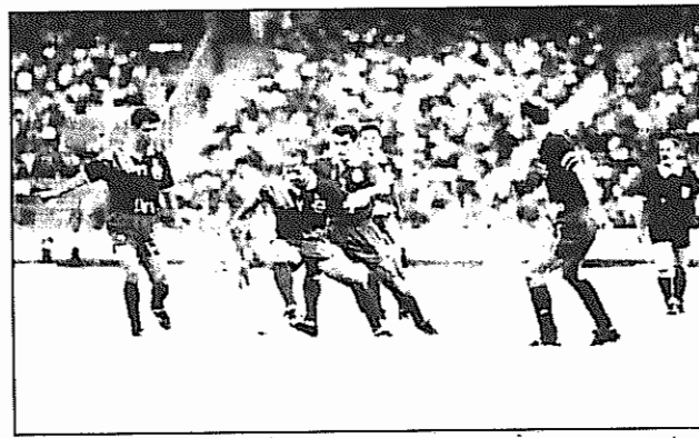
صحنه‌ای از مسابقات هفته دوم لیگ سراسری فوتبال

پاس راشکست داد. پس از پایان دیدارهای هفته اول تیم استقلال تهران به دلیل استفاده از یک بازیکن غیرمجاز در مسابقه با برق شیراز با نتیجه سه بر صفر بازنده اعلام شد. در هفته دوم جام آزادگان پاس با یک گل از سد ملوان انزلی گذشت. پیروزی در یک بازی بدون گل در مقابل شمشوک نوشهر به یک امتیاز رضایت داد. بهمن و آرات نیز با نتیجه مشابه میدان بازی را ترک کردند. استقلال و کشاورز در زیبا ترین بازی هفته دوم لیگ سراسری کشور به تساوی ۲ بر ۲ دست یافتند. استقلال اهواز در تبریز شهرداری این شهر را با یک گل شکست داد. در شیراز سپاهان اصفهان و برق شیراز در دربی هم قرار گرفتند. این بازی نیز با نتیجه صفر بر صفر پایان گرفت. جنوب اهواز در خانه خود با نتیجه ۲ بر یک بر ماشین سازی تبریز پیروز شد.