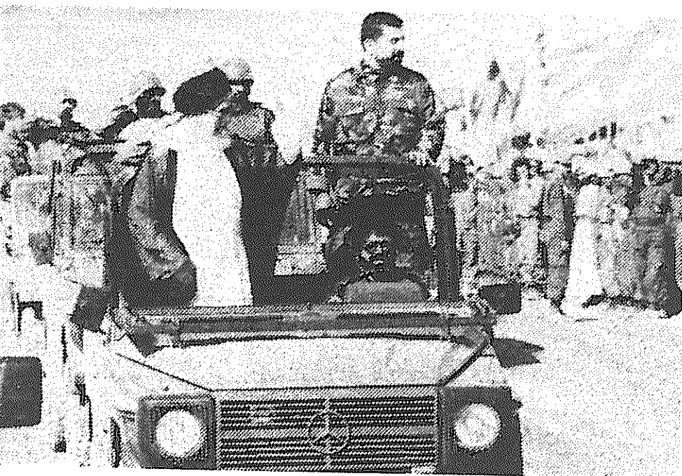
خامنه ای در حال بازدید از مانور عاشورا. در این مانور که دو هفته پیش در جنوب تهران برگزار شد، بیش از ۱۰۰ هزار پاسدار شرکت داشتند. هدف این مانور ترساندن مردم بود. رژیم قدرتی را به رخ مردم کشید که هر روز بیشتر تحلیل می رود

بقیه از صفحه ۱ انتخابات آینده ریاست جمهوری به جای هاشمی رفسنجانی رئیس جمهور شود. او برای این منظور در اساس به حمایت جامعه روحانیت مبارز امید بسته است. استعفای کنی می تواند او را از امکانات بیشتری به این منظور برخوردار سازد اما