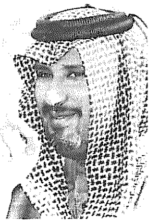
حماد الثانی حاکم جدید قطر