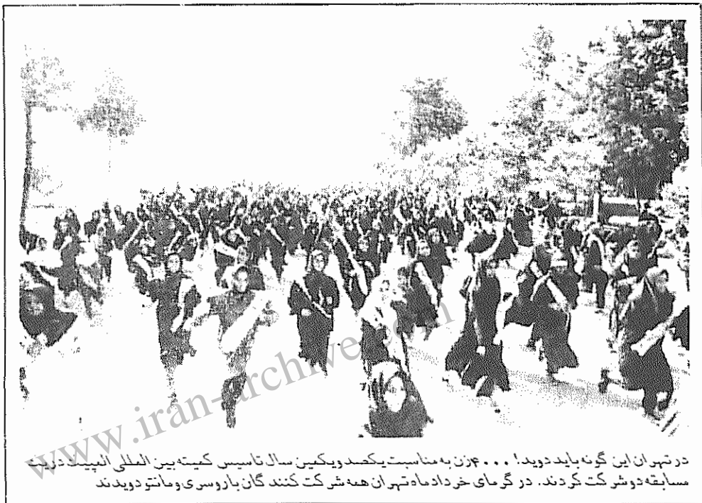
در تهران این گونه باید دید... ۳۰۰۰ زن به مناسبت یکصد و یکمین سال تاسیس کمیته بین المللی امنیت درخت مسابقه دوشرکت کردند. در گامی خرد دامه تهران همه شرکت کنندگان با روسی و مانتر دودیدند

دارد و نه در خارج از کشور، حزبی که متلاشی شده و نه در خارج و نه در داخل حضور دارد، ملی گرایانی که اصلا موجودیت ندارند، سلطنت طلبانی که موجودیت سیاسی ندارند، روشنفکرانی که... و در مقابل، آن هایی که در شورای ملی مقاومت گرد آورده شده اند با توصیفات زیر معرفی شده اند: بخش مخالف طرفداران شوروی در سازمان چریک های فدایی خلق و در مقابل آن هایی که خود را اکثریت می نامیدند، نماینده نویسندگان، نماینده ملی گرایان، نماینده بازاریان، نماینده ورزشکاران و... و با این توصیفات کدام حزب مخالف مجاهدین باقی می ماند که آن ها به او وعده آزادی در ایران فردا را می دهند؟ برای منصرف کردن مجاهدین از ادامه این شیوه های نفی گرایانه و تخریبی شاید چندان کار موفقی نتوان انجام داد، اما برای از بین بردن امکان بروز این واژگونه سازی ها کار و وظایف بسیاری در مقابل نیروهای که واقعا به برقراری آزادی های اساسی در ایران فردا معتقدند، وجود دارد.