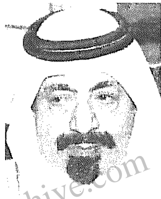
خلیفه الثانی حاکم سرنگون شده

جدید قطر، از سیاست گذاران عمده این امیرنشین در سال های اخیر بوده است، به نظر نمی رسد کودتای اخیر، تغییر چندانی در مشی سیاسی خارجی این کشور در پی داشته باشد. اینکه تا چه حد امیر جدید، در سلطنت مطلقه خاندان ثانی که ۲۰۰ سال است ادامه دارد، تغییرات وارد کند، آینده نشان خواهد داد. قطر نیز که با درآمد سرانه ۱۵ هزار دلار، از ثروتمندترین کشورهای جهان است و ذخایر فراوان نفت و گاز دارد، همچون سایر کشورهای محافظه کار جنوب خلیج فارس، به سبکی قرون وسطایی اداره می شود. ۵۰۰ هزار نفر اهالی قطر که بسیاری از آنان را اتباع خارجی (و از جمله ایرانیان) تشکیل می دهند، از هر گونه مشارکت در تعیین سیاست ها محروم اند. امیر قطر، حکومت خود را حداکثر به نایب افراد بانفوذ خانواده اش می رساند و پس، تنها جمعی که حاکم با آن مشورت می کند، یک جمع انتصابی رایزنان است.