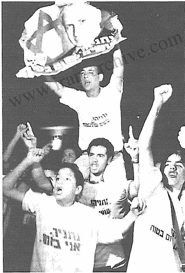
شادی طرفداران نتان یاهو پس از پیروزی در انتخابات

● چگونه در مورد نتان یاهو قضاوت می‌کنید؟ □ مشکل نه نتان یاهو بلکه سیاستمداران راست اطراف او هستند که مایلند ما را در اردوگاهها حبس و یا از کشور بیرون کنند. نگرانی من اینست که نتان یاهو در پیرویه صلح مانع ایجاد کند و ساختن مشهورکهای هودی نشین جدید در هیرون را آغاز کند. ● آیا عرفات تضعیف خواهد شد؟ □ روزهای سختی در پیش است. عرفات بر روی پرز و حزب کارگر حساب کرده بود علیرغم آنکه آنها سیاست مجازات جمعی را علیه فلسطینی‌ها پیش بردند. عرفات بایستی به روی مشکلات فلسطینی‌ها تکیه می‌کند. وقتی فشار زیاد شود، وضعیت سیاسی به حال انفجار درمی‌آید. عرفات و مقامات دولت فلسطین حماس را تحت کنترل دارند