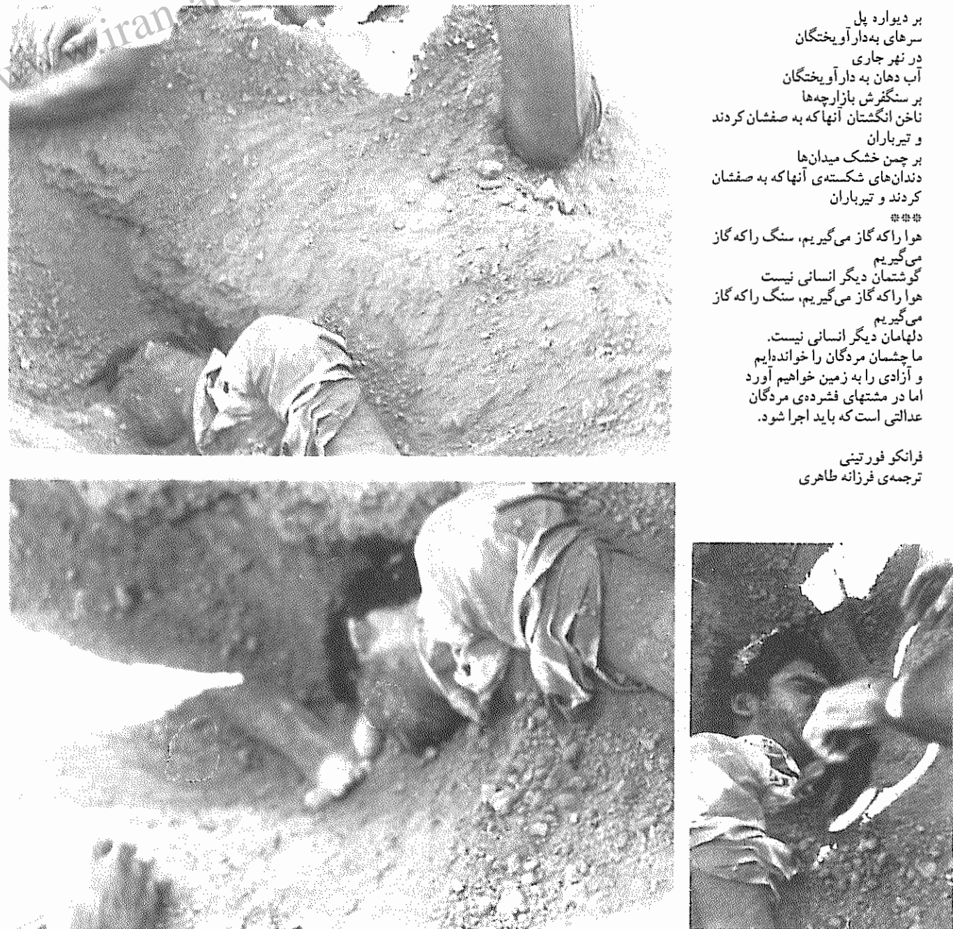
بر دیواره پل سهرای به‌دار آویختگان در نهر جاری آب دهان به دار آویختگان بر سنگفرش بازارچه‌ها ناخن انگشتان آنها که به صفشان کردند و تیرباران بر چمن خشک میدان‌ها دندان‌های شکسته‌ی آنها که به صفشان کردند و تیرباران *** هوا را که گاز می‌گیریم، سنگ را که گاز می‌گیریم گوشتان دیگر انسانی نیست هوا را که گاز می‌گیریم، سنگ را که گاز می‌گیریم دل‌هایمان دیگر انسانی نیست. ما چشمان مردگان را خوانده‌ایم و آزادی را به زمین خواهیم آورد اما در مشت‌های فشرده‌ی مردگان عدالتی است که باید اجرا شود. فرانکو فورتینی ترجمه‌ی فرزانه طاهری

در نیش اولیه یک گور فردی! و در ادامه نیش، پای قربانی دوم و دست قربانی سوم در کنار جسد قربانی اول! در این گور جمعی جنایتکاران چند نفر را چال کرده‌اند!