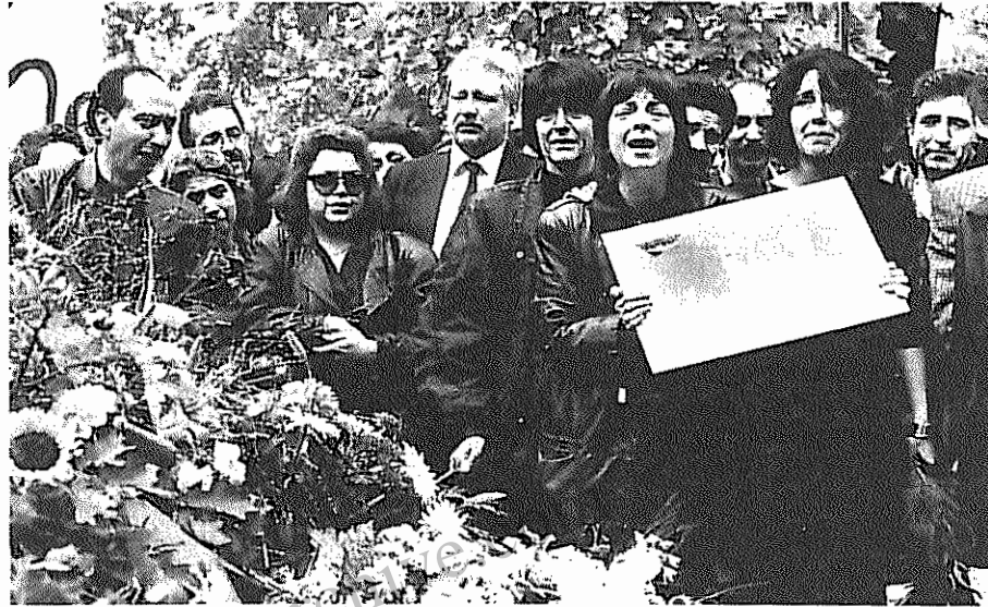
در سوگ قربانیان ترور برلین