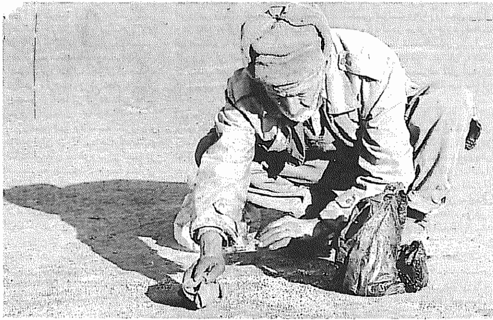
دانه برنجی چند، بازمانده از گذر باری شتابناک

کشورهای آسیای جنوب شرقی و اقیانوس آرام هم وضع چندان خوشایندی ندارند. در این کشورها ۱۷۰ میلیون نفر زیر خط فقر زندگی می‌کنند و ۲۵ میلیون نفر مبتلا به ایدز هستند. یکصد میلیون نفر دوران دبیرستان را طی نمی‌کنند و یک میلیون زن بی‌سواد هستند. میزان مرگ و میر مادران ۳ تا ۴ برابر هر صدهزار زایمان است و از هر سه کودک یک نفر از سوء تغذیه رنج می‌برد. تقریباً یک میلیون کودک به سن ۵ سالگی نمی‌رسند. این همه در حالی است که درآمد سرانه‌ی این کشورها سالانه بیش از ۵ درصد رشد داشته است که بالاترین نرخ رشد در جهان می‌باشد.