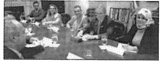
اعضای دولت موقت عراق در دیدار با بوش

گفت: نیروهای وابسته به گروه‌های کرد، برای حفظ امنیت و کمک‌های انسانی، به کرکوک وارد شدند و قصد ماندن در این شهر را ندارند. پیش از این سخنگوی