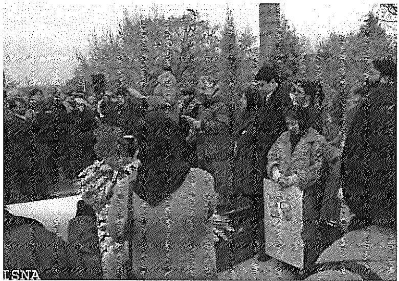
این پرونده به ۵ سال حبس محکوم شده است، در سالگرد قتل محمد مختاری و محمد جعفر پوینده پیامی را صادر کرد.