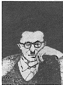
آثار ملی به ثبت رسید. به گزارش خبرنگار فرهنگ و اندیشه ایلنا، برادر صادق

جهانگیر هدایت سپس به لوازم شخصی هدایت که توسط دولت جهت ایجاد موزه از وراثت گرفته شده اشاره کرد و ادامه داد: این آثار شخصی نزدیک به ۲۰ سال در انبار موزه رضا عباسی