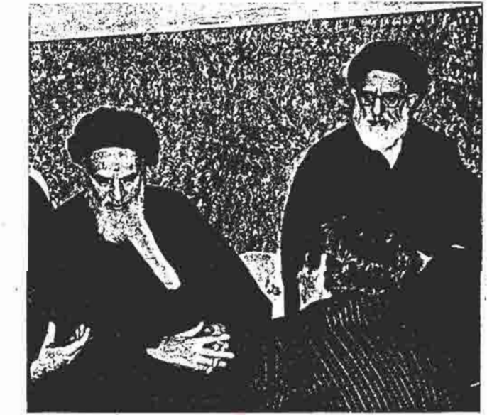
این عکس توسط آقای بانگی داماد پدر طالبانی ما تهیه شده است.

کجاست پدر طالبانی تاشاده کد که در امروز امام خستی بربرد و بجههای کوچک و زنان و مردان و پدران و مادران دلبر ما حاضرند که سلسل بدست گیرند تا با "شهید شوند و با شرف و نابودی ارتجاع حاکم بر آنها آها میتوان باور داشت که رژیم از داخل بوسیده پهلوی و اربابان سرگردان انگلیسین دچار سرنوشت سایر جانیانگران تاریخ نگردند.