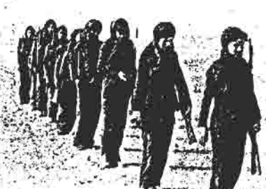
شکست هر رژیم و به خون پییدهای منتظر دستان است، خواهار!