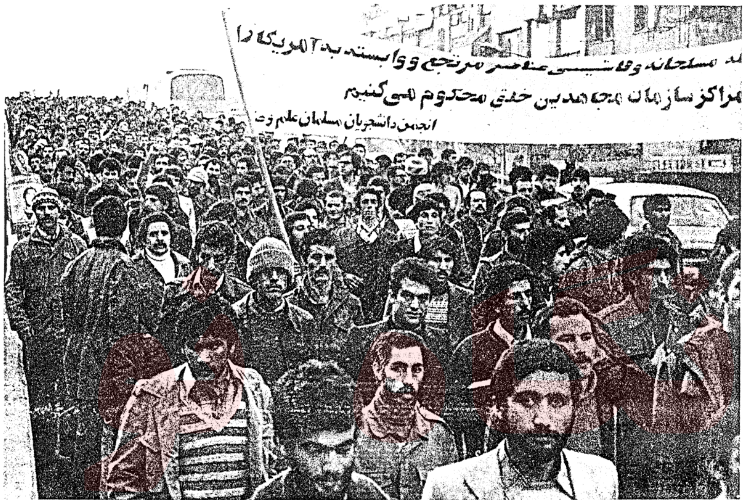
راهپیمائی انجمن‌های دانشجویان مسلمان بحمايت از تحصن مادران شهدای مجاهدین خلق.