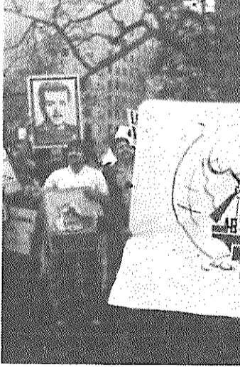
شرکت طرفداران مجاهدین خلق در مراسم فلسطینی‌ها که گروه‌های بسیاری از سازمان‌های آزادیبخش دنیا نیز در آن شرکت کرده‌بودند.

فلسطین - تنها نماینده‌ی برحق آنان - و با اهداف اصلی بازگشت به وطن خویش و حق خودمختاری و تاسیس یک دولت مستقل فلسطینی ادامه می‌دهند. آمریکا و دست نشاندهانش سادات و بگین در زباله‌دان تاریخ مدفون خواهند گشت. ما بر ضرورت پیوندی هرچه مستحکمتر میان انقلاب ما و حرکت‌های آزادیبخش جهان تاکید نموده و می‌گوئیم که رمز پیروزی در مبارزه‌ی آزادیبخش، ایجاد جنبه‌های ضد امپریالیستی و ضد صهیونیستی در درون و بیرون مرزها می‌باشد. ما ایرانیان در پشتیبانی از مبارزه و خواسته‌های فلسطین استوار ایستاده و حمایت‌های مالی و نظامی