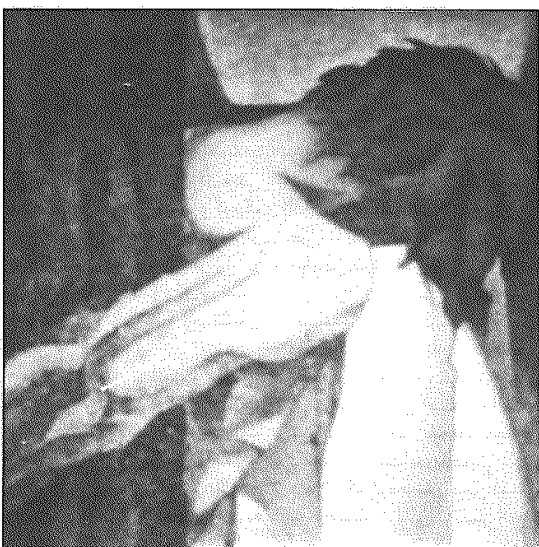
شکجه: طرحی از "پاولو گامارگو" شاعر و طراح برزیلی

گسترش تاریخی شورا و تدارک قیام عمومی خلق نه تنها پاسخ مناسب به کاست‌سازی خمینی و امپریالیسم است، بلکه موجب ناکامی ضدخلق مغلوب است که در تلاش‌های پراکنده‌سازی نیروهای خلق و دلبری از امپریالیسم سر از پا نمی‌شناسد.