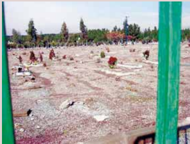
... و آرامگاه سردار و دیگر شهیدان ۱۹ بهمن