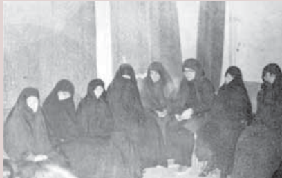
... و در آموزش مادران و زنان