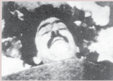
پیکر به خون تیبیده سردار