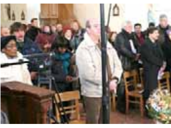
شرکت هیات مقاومت در مراسم یادبود آبه پیر بر سر مزارش در نرماندی

زاید محصل شده است. تن امیلودر بزودی شاهد پایان مصیبت ایرانیان بر اثر دیکتاتوری مذهبی باشیم. خیرگزاری فرانسه افروزدادگاه اروپا روز ۱۲خامسار، بلوگمشهدارایهنگارمجاهدین خلق توسط اتحادیه اروپا را اعلام کرد و بدین ترتیب معلمان سازمان را از لیست سازمانهای تروریستی خارج ساخت. آبه پیر علاوه بر معظوظ خارج کردن مجاهدین خلق از این لیست تلاش کرد. یک ماه بعد بود که آبه پیر، محبوبترین شخصیت فرانسه، که در قلب دهها میلیون فرانسوی جای داشت، درمان دروغ و بدعهدی ملیون فرانسوی که به او عشق می‌ورزیدند، به رحمت اودی پوست.