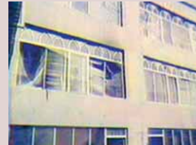
پایگاه سردار پس از حمله مزدوران