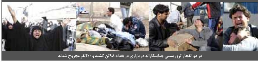
در دو انفجار تروریستی جانبکارانه در بازاری در بغداد ۹۸تن کشته و ۲۰۰ انفجر مجروح شدند