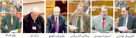
انجودیدال کورائلس استروان استیونسون ویتالیس لاندزبرگیکس یانوش اونیسکوویچ اریک مایر یانپولو کاساکا