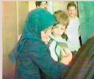
در کنار فرزندان شهیدان