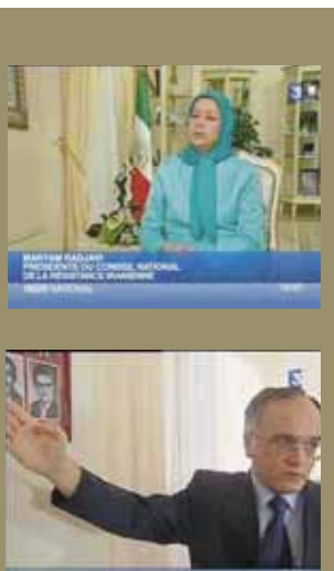
چه در گردهمایی ۵۰هزار نفره ایرانیان در منطقه پاریس، چه در سالنهای بزرگ پارلمان اروپا، مریم رجوی به‌شکلی خستناکی ناپذیر به خواهان خارج ساختن مجاهدین از لیست سازمانهای تروریستی اروپاست