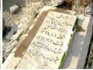
حسین کریمی بخش تاریخ شهادت: ۱۰ اسفند ۶۲