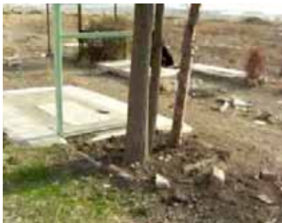
گاه ردیف گورها را به صورت مجموعه‌ای دو سه تایی می‌یابیم و گاه به صورت تکی، برسر برخی مزارها درختی دیده می‌شود. اما اغلب گورها سنگناشان شکسته است