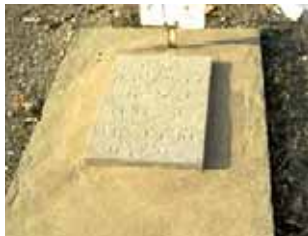
اصغر غفوری تاریخ شهادت: ۲ مهر ۶۴