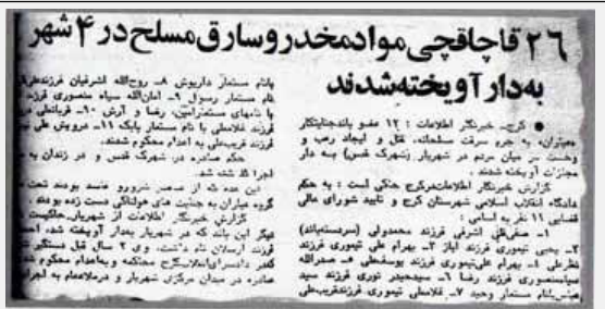
یکی از نمونه های اعلام مجاهدین اسیر تحت عنوان قاچاقچی (روزنامه اطلاعات ۱۰ بهمن ۱۳۶۷)

(نقل از مجاهد ۲۷-۲۸ بهمن ۶۷) عیاران خاطره مجاهد شهید صفی قلی اشرفی و یاران پاکبازش گرمای یاد گمنامان بیشمارانند. المان زلال ستاره در آخون در شیب برق نهد چشم عیاری شگبرگ خون سینه گاهی بیشمار گمنام را طلب خواهد کرد