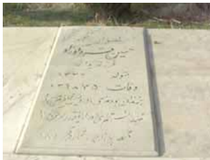
حسن قره گوزلو تاریخ شهادت: ۵ مهر ۶۸