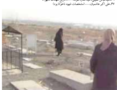
قطعه شهیدان گورستان بهشت سکینه قطعه برت و گمنامی است که هزار گاهی میمانی را پذیرا می‌شود. بسیاری از گورها توسط خانواده‌ها شناسایی نشده‌اند اما مردم با حقیقت‌سنجی نسبت به فرزندان مجاهد و مبارزان به آنها رسیدگی کرده‌اند