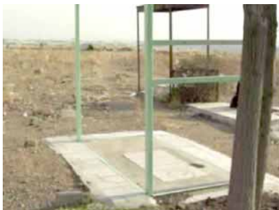
گورستان بهشت سکینه که نزدیکی زندان قزلحصار کرج قرار دارد و از دور برج زندان و دیوارهای آن را می شود دید

گورستان بهشت سکینه، گورستانی است واقع در یک کیلومتر ۴ ایوان کرج - فزوی، در نزدیکی زندان قزلحصار و گوردهشت. در یکی از قطعات این گورستان تعدادی از شهیدان مجاهد خلق و دیگر شهیدان راه آزادی که عمدتاً اسیران زندانهای قزلحصار و گوردهشت بوده‌اند آرمیده‌اند. از پیش از این به صورت افواهی شنیده بودیم که تعدادی از تیرباران شدگان زندانهای قزلحصار و گوردهشت را به صورت گمنام در یکی از قطعات این گورستان دفن کرده‌اند. اما اخیراً هواداران مجاهدین موفق شده‌اند این قطعه گمنام را شناسایی کرده، از آن قلمبرداری کنند و همراه با توضیحاتی پیرامون برخی از شهیدان پرایمان ارسال نمایند. تصاویری که در این صفحات مشاهده می کنید، عمدتاً از روی قلمبه‌پرایمان گرفته شده‌اند. در صفحه اول تصاویری از صحنه و موقعیت کلی گورستان را ملاحظه می کنید. بنا بر این تعدادی از گورها این قطعه دارای سنگ می باشند و بنا بر این قابل شناسایی هستند. نام و نام خانوادگی، تاریخ تولد و تاریخ شهادت آنان بر سنگ گورها حک شده است. البته در قلمبه‌پرایمان