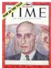
بعد از پیروزی صفق بر شرکت نفت، او به عنوان مدیر سال معرفی شد