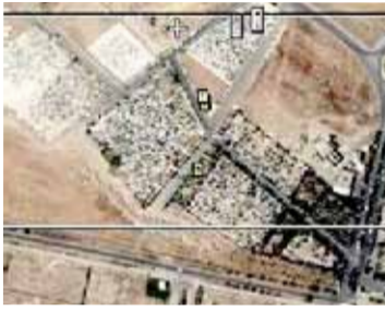
گورستان بهشت سکینه واقع در کیلومتر ۱۴ اتوبان کرج - قزوین بر روی نقشه