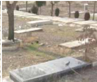
میهمانی نشاناس گاه به گورها سر می زنند و با کلی خاطره شهیدان را زنده نگه می دارند