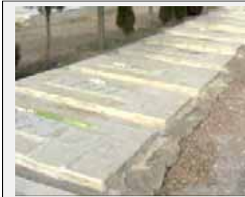
ردیف گورهای «عیاران» مجاهدین فهیانی که مظلومانه تحت عنوان قاچاقچی توسط جلالان آخوندی به دار آویخته شدند