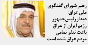
رهبر شورای گفتگوی ملی عراق: دیدار رئیس‌جمهور رژیم ایران از عراق باعث تنفر تمامی مردم عراق شده است