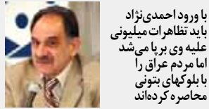
با ورود احمدی‌نژاد باید تظاهرات میلیونی علیه وی برپا می‌شد اما مردم عراق را بلوکهای بتونی محاصره کرده‌اند