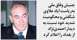
جنبش وفای ملی به‌ریاست ایداع علوی شگفتی و محکومیت شدید خود نسبت به دیدار احمدی‌نژاد از بغداد را اعلام کرد