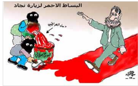
صوت العراق ۲۲ اسفند ۸۶:

مرکز اطلاع رسانی صوت العراق در روز ۱۳ اسفند، با درج کاریکاتوری نشان داد که شبهه نظامیان وابسته به رژیم ایران در عراق با خون مردم این کشور زیر پای پاسدار احمدی نژاد فرس سرخ بین می کنند.