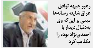
رهبر جبهه توافقی عراق شایعه رسانه‌ها مبنی بر این که وی به‌دنبال دیدار با احمدی‌نژاد بوده را تکذیب کرد

نیروهای ملی و دموکراتیک، رهبران فراکسیونهای پارلمانی، و بیش از ۱۳۰ تن از شیوخ عسایر استانه‌های جنوبی سفر احمدی‌نژاد را محکوم و از حضور مجاهدین در عراق حمایت کردند