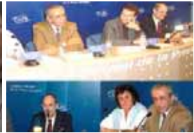
جلسه مطبوعاتی برای معرفی کتاب شواریاس علیه مجاهدین، همراه با مزدور خیاصلو - ۲۰ آوریل ۲۰۰۵ - تجمع مزدوران در مقابل پارلمان فرانسه ۲۴ مارس ۲۰۰۵