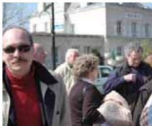
تظاهرات مزدوران وزارت اطلاعات در اورسورواژ