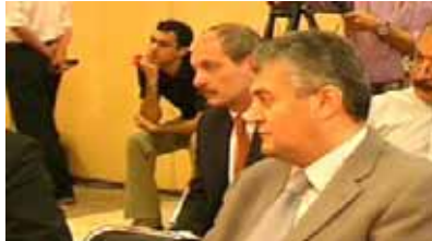
جلسه مزدور فیروزنده - پاریس ۲۴ ژوئن ۲۰۰۵