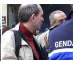
تظاهرات مزدوران در اورسورواژ