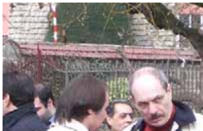
سازماندهی مزدوران وزارت اطلاعات در اورسورواژ