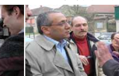
تظاهرات مزدوران وزارت اطلاعات در اورسورواژ