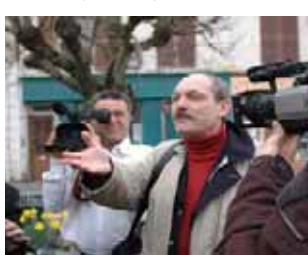
تظاهرات مزدوران وزارت اطلاعات در اورسورواژ