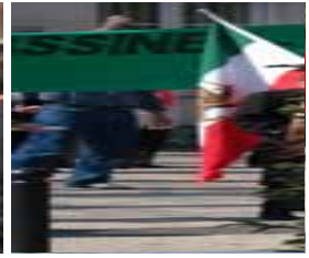
سازماندهی مزدوران در مری سورواژ ۲۹ مارس ۲۰۰۵