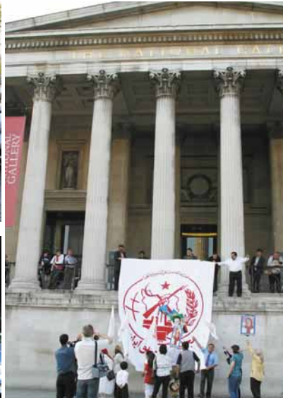
لندن - انگلستان