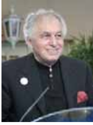
این یک خوشحالی عظیم برای من است که در کنار شما زرمندگان آزادی و شریک شادی شما باشم. و خام رئیس جمهور، این بزرگوار شما را ممناس می‌کند که ما را شایسته دانستید که شریک شادمانی شما باشیم و در این پیروزی تاریخی در مسیر یک مبارزه سخت با مسعود رجوی، با اشرافیت و با ملت ایران شریک باشیم، برای بازگشت قریب‌الوقوع به یک ایران آزاد ایران برادر.

شما نه تنها یک آرمان عادلانه را پاسداری کردید بلکه حیثیت اروپا را نیز پاسداری نمودید حیثیتی که به دلیل تصمیمات نادرست به انحراف کشیده شده بود