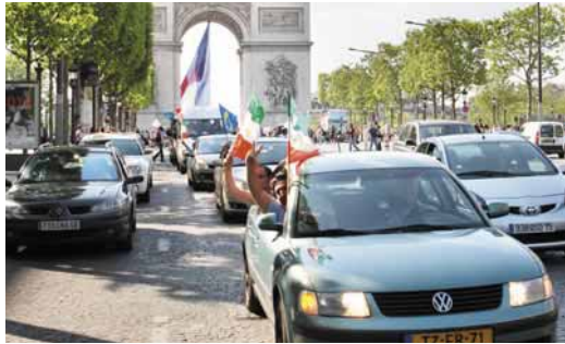
پاریس - فرانسه