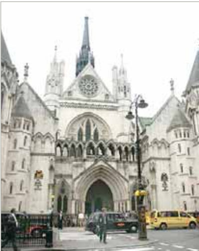
دادگاه استیناف انگلستان در لندن

استیناف پس از یک کارزار سه‌هفته‌ای حقوقی-سیاسی و دیپلماتیک در انگلستان، روز چهارشنبه، ۱۸ اردیبهشت ماه، دادگاه تجدیدنظر انگلستان به ریاست قاضی القضاة انگلستان، لرد نیکلاس فیلیس، که توسط قاضی ارشد دیگر این دادگاه، لرد جان لاز و لیدی مری آزود، همراهی شد، به اتفاق آراء درخواست وزیر کشور انگلستان را برای کسب اجازه جهت استیناف خواهی از دادگاه تجدیدنظر فاعله مردود شمرده و حکم دادگاه استیناف سازمانهای مسنوعه (پولک) را که تصمصیم وزیر کشور انگلستان سازمانهای استیناف سازمانهای مسنوعه، در در دادگاه استیناف ۳۳۵ تا زمانیکه گان و مجلس انگلستان برای رفع مسئولیت مجاهدین، تادرسات و افرغضقلای «توصیف کرده بود» مورد تأیید قرار داد.