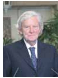
پیکار پیروزی به شما بگویم، برای یک وکیل غیر معمول است که وارد پرده می‌شود که با این چنین شور و اشتیاق روبرو بودم. این که امروز که کنار شما هستم واقعاً بزرگترین افتخار و خوشحالی برای من است.

زمان آن رسیده که سیاستمداران اروپایی فشارهای لازم را بر دولت‌نمندان اروپایی وارد کنند، و فکر می‌کنم که کام بزرگی در این مسیر برداشته شد