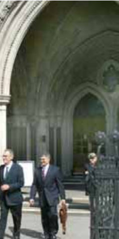
تجمع ایرانیان آزاده در مقابل دادگاه استیناف انگلستان پس از اعلام حکم