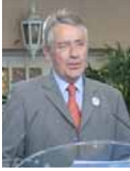
خاتم رئیس جمهور، دوستان عزیز، ما از جانب کمیته فرانسوی برای ایران دموکراتیک این پیروزی شگفتناک، پیروزی برای عدالت را به شما تبریک می‌گوییم.

قرار گرفتن نام سازمان مجاهدین در لیست تروریستی امروز در یک کشور تصحیح شده و اثبات می‌کند که وقتی سیاستمداران مرتکب اشتباه می‌شوند قانونگذارانی هستند که آن را تصحیح کنند