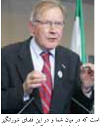
است که در میان شما و در این فضای شونگنیز هدف نهایی این است که ملت ایران وحدت و سعادت خود را باز یابد و در این مسیر، امروز واقعاً روز بسیار زیبایی است و این نتیجه بسیار زیبایی که از دادگاه استیناف لندن آوردیم قطعاً که خبر خوبی برای ملت ایران خواهد بود.

هدف نهایی این است که ملت ایران وحدت و سعادت خود را باز یابد و در روز بسیار زیبایی است