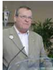
مقدمه شادی بزرگی است که با تحقق آزادی و دموکراسی در ایران به وجود می‌آید. قطعاً این پیروزی را در تهران گرامی خواهیم داشت.

از هم اکنون باید ببیند بشیم... که چگونه می‌توانیم روی دولت فرانسه فشار بیاوریم که به زودی ریاست اتحادیه اروپا را به دست خواهد گرفت تا این دولت نقش شایسته خودشن را ایفا کند