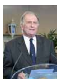
حکمی که دادگاه در ساعت ۱۱ امروز اعلام کرد، می‌گوید که وزیر کشور انگلستان هیچ دلیلی برای ممنوع کردن سازمان مجاهدین ندارد

عصر بخیر، روز بسیار زیبایی است و یک افتخار بزرگ برای من که دعوت شده‌ام تا به نمایندگی از جانب صدقا عضو مجلسین محترم و اعیان انگلستان در این جا باشم. نمایندگی که در حمایت از آرمان‌شمار مبارزه کردند، و در کنار لرد اسلین را دارم. ما امروز این نتیجه بسیار شگفتناک را شنیدیم من می‌خواستم شخصاً این جا باشم که این پیام هیبتناکی را به مردم برمی‌رسانم و به شما بدهم.