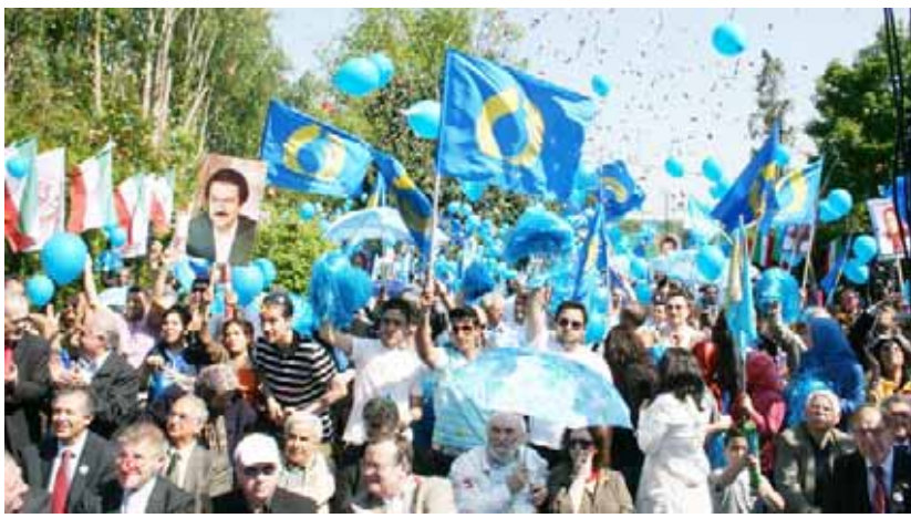
ولی استیانت از رژیم ایران جواب نداد. هنگامی که فرانسه ریاست سرخ‌رنگ اتحادیه اروپا را از اول ژوئیه بدست می‌گیرد، امیدوارم که رئیس جمهور ساکوزی خط قطع حمله برنام هسته‌ای ایران را ادامه بدهد. ولی حرف زدن قطعاً زمانی که ما عمل هم را می‌شود هیچ حساسیتی ندارد. قویترین پیامی که می‌توانیم به آخوندها بفرستیم است که سازمان مجاهدین خلق ایران را از لیست تروریستی اتحادیه اروپا حذف کنیم و از آنها به‌عنوان نمایندگان اولین کسانی بودند که برنامه هسته‌ای آخوندها را افشا کردند و به‌خاطر