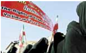
یمن آرزو، ۳۱ اردیبهشت ۸۷