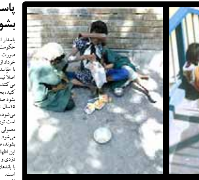
سختگوی کابینه پاسدار احمدی نژاد: یک قشر معدود به اندازه انگلستان یک دست از ۹۴ هزار میلیارد تومان استفاده می کنند و یک قشر بزرگ از شش هزار میلیارد تومان