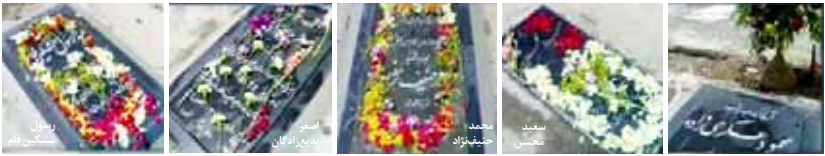
به مناسبت سالگرد شهادت بنیانگذاران و دو تن از اعضای مرکزیت سازمان مجاهدین خلق ایران، هواداران مجاهدین در تهران مزار این شهیدان والاقدار را در بهشت زهرا تهران گلباران کردند