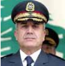
میشل سلیمان رئیس‌جمهور جدید لبنان

پس از کودتای خوین و تفرقه‌ها رژیم آخوندی در لبنان، روز اول خرداد، جناح‌های متخلف این کشور پس از شش روز مذاکره در دوحه، توافق پشنهادهی فطرافضا کردند تا به بحران سیاسی ۱۸ماهه این کشور پایان دهند. این توافق شامل تعیین رئیس‌جمهور جدید و تشکیل یک دولت وحدت ملی جدید بود. براساس این توافق در کابینه لبنان، ۱۶کسی به جناح اکثریت، ۱۱کسی به مخالفان دولت و ۳کسی به رئیس‌جمهور جدید دادند. همچنین ۱۶کسی به جناح اکثریت انتخاب شدند. توافق مذکور همچنین به جناح اکثریت اجازه داد که نخست‌وزیر را انتخاب کند. بعد از عقد نظر میانجیگری فواد السنیوره نخست‌وزیر لبنان، با استقبال از افزایش دوحه، آن را گام مهمی برای گسترش حاکمیت دولت در لبنان بیان دانستند. سعد حریری رئیس‌جمهور لبنان نیز اطمینان از نتایج این توافق را در بیان کرد و بر این باور است که توافق مذکور زمینه‌ساز پایان دادن به بحران لبنان خواهد بود. همچنین بر این باور است که توافق مذکور زمینه‌ساز پایان دادن به بحران لبنان خواهد بود.