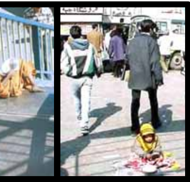
سختگوی کابینه پاسدار احمدی نژاد: یک قشر معدود به اندازه انگلستان یک دست از ۹۴ هزار میلیارد تومان استفاده می کنند و یک قشر بزرگ از شش هزار میلیارد تومان