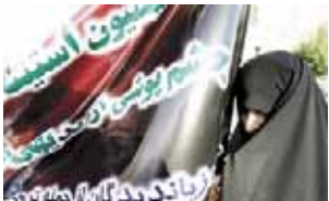
یمن آرزو، ۳۱ اردیبهشت ۸۷