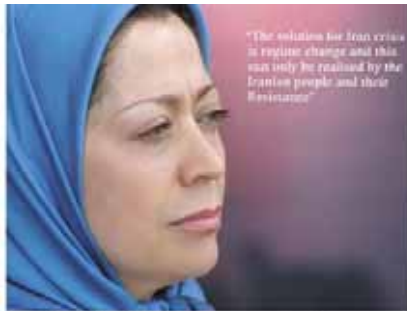
راه حل بحران ایران، تغییر رژیم است و امر این تنها به دست مردم ایران و مقاومتشان میسر خواهد شد.

حیات کند که مردم خود را سرکوب می کند، زندگیاور و سزایان انگلیسی را به گروگان می گیرد یا با بغل می رساند؛ رژیم که صلح و امنیت جهانی را به خطر انداخته است. من به سیاستمداران انگلستان یادآوری می کنم که آنها اشتباه بزرگی را مرتکب می شوند. آنها روی اجماع تغییر رفتار رژیم ملامت سزایان انگلستان می گذارند. این حقیقت که بسیاری از اعضای گروه مجلس سیاست استانت را رد کرده اند استقلال می کشد. آنها از سرکوب و ظلم و بی عدالتی در کورس و سوتیل و سوتیل و محقق شده، به حمایت از مقاومت برخاسته اند. برعکس آنها گروه یک نموده درختان از روایط ایله میان انگلستان و مردم ایران است.