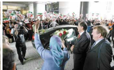
استقبال از احساسات حامیان مقاومت و هموطنان مقیم بلژیک در مقابل پارلمان اروپا در بلژیک