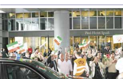
حفظ نام مجاهدین در این لیست وجود ندارد. من مطمئن که رژیم اوخاندان در حال فشار آوردن بر شورای وزیران است. ۲۷ کشور اتحادیه اروپا باید این حکم را قبول کنند و دینی در این باره بگذرد ولی بلژیک اوخاندان به شمار خواهد آمد و آنها را جریر خواهد نمود.