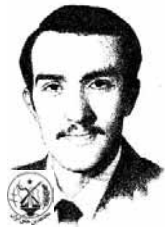
سخن از ماندن و ماندنی نیست سخن از رفتن هم نیست. تخیل زود می‌رود دیگر ماند، سخن از سوختن است

مجاهد کربا رضای یکی از برجسته انقلابی تاریخ معاصر ایران و درخشانترین چهره‌های انقلاب مسلمانانه معاصر بود. نمونه نامواری که حریف کسی نبود. آن را یک پاکت پوایوتف مجاهدین حقوق رضا عضو کمیته مرکزی مجاهدین و از اولین اعضای سازمان بود که پس از بنیانگذاری مجاهدین در سال ۱۳۵۴ همراه با برادر بزرگش احمد سازمان پیوست و در دامان مفیدی و تشکیلاتی حریف بی‌پروم خود را گذراند. او خود در این باره می‌گوید: