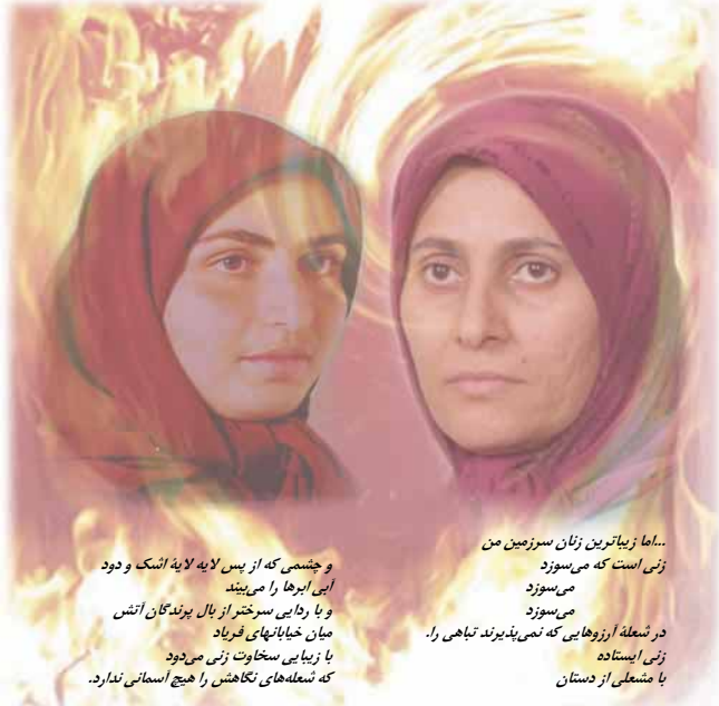
...اما زیباترین زنان سرزمین من زنی است که می‌سوزد می‌سوزد می‌سوزد در شعله آرزوهای که نمی‌پذیرند تباهی را. زنی ایستاده با شعله‌ای از دستان