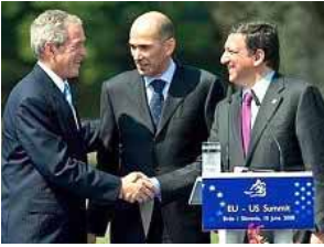
جورج بوش، رئیس‌جمهور آمریکا

گزینه نظامی برای مقابله با رژیم ایران همچون مطرح است. بوش پاسخ مثبت داد و گفت: «آری، چنین است...». در این سفر، مردم در روز چهارم از رژیم ایران در مورد برنامه هسته‌یی خود سؤال کردند. جهان آزاد باید کاری کند که در زمینه هسته‌یی رژیم ایران با آمریکا همکاری کند. رژیم ایران از غنی‌سازی اورانیوم استفاده می‌کند که برای تولید بمب هسته‌یی لازم است. آمریکا می‌خواهد رژیم ایران را از غنی‌سازی اورانیوم منع کند. بوش گفت: «ما می‌خواهیم رژیم ایران را از غنی‌سازی اورانیوم منع کنیم. ما می‌خواهیم رژیم ایران را از غنی‌سازی اورانیوم منع کنیم. ما می‌خواهیم رژیم ایران را از غنی‌سازی اورانیوم منع کنیم.»