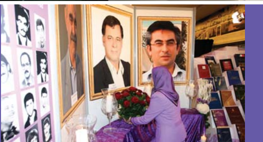
ادای احترام به شهیدان در نمایشگاهی در محل کنفرانس بین المللی بروکسل