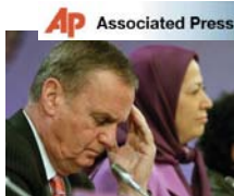
مریم رجوی، رئیس‌جمهور برگزیده اپوزیسیون شورای ملی مقاومت ایران و ژنرال آمریکایی جیمز چوزن مشاور امنیت ملی، در کنفرانس بین‌المللی در مورد سیاست ایران در بروکسل سشنه ۲۵ ژانویه ۲۰۱۱

خبرگزاری بلژیک، ۲۵ ژانویه ۲۰۱۱ سناتور درک کلاس از حزب دموکرات مسیحی و رئیس کمیته پارلمانی بلژیک برای یک ایران دموکراتیک از وزیر خارجه بلژیک واناکر خواستار اقدام فوری بابت وضعیت حقوق بشر در ایران شده است. سناتور درک کلاس، این فراخوان را به دنبال شرکت در کنفرانس بین‌المللی اپوزیسیون ایران سازمان مجاهدین خلق در روز سه‌شنبه ۲۵ ژانویه در قبال اشرف و حمله اشرف و حمله اشرف که در بروکسل و اعدام دو عضو این جنبش که خواستار یک دولت صلح‌آمیز و دموکراتیک و سکولار هستند اعلام کرد. آن سال گذشته به خاطر شرکت در تظاهرات علیه رژیم ایران دستگیر شده بودند. در نامه‌ی به وزیر خارجه واناکر سناتور خواستار تحقیقات جدی درباره نقض حقوق بشر در ایران شده است. او گفت: اکنون بسیاری از اعضای اپوزیسیون در زندان بدون محاکمه بسر می‌برند. جامعه بین‌المللی نگران است که حکومت وحشت رهبران ایران در ماه‌های آینده رویه سخت‌تری را به تظاهرات خیابانی در کشورهای عربی پیش بگیرد.