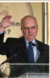
رئیس سازمان اطلاعات مرکزی آمریکا در سال ۲۰۰۵ تا ۲۰۰۷

ایران در حال حاضر در مسیری است که به سوی عقب‌نشینی از منطقه خاورمیانه است. این امر به همان اندازه مهم است که ما در خارج از آمریکا به آن دست یابیم.