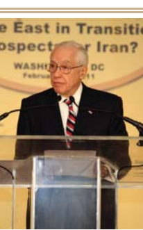
وزیر دادگستری آمریکا در سال ۲۰۰۷ تا ۲۰۰۹

در ماههای دسامبر و ژانویه در کنفرانسهایی در واشینگتن و اروپا من اشاره کردم که ما در یکی از آن لحظات تاریخی هستیم که می‌توانیم سناریوهای آینده را در مورد ایران پیش‌بینی کنیم. خوب است و مقاومت در برابر آنچه شیطان می‌خواهد چه کردیم. حواشی حتی از فوری‌ترین شعارها پستی گرفتند اما اینک در فاصله زمانی کوتاه نزدیک به دو هفته و در حالی که هنوز در راه هستیم می‌توانیم ببینیم که آیا این کشور به سوی آزادی در حرکت است یا خیر. ما در این مسیر هستیم و این امر بسیار مهم است.