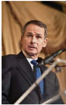
رئیس ستاد مشترک ارتش آمریکا از سال ۲۰۰۵ تا ۲۰۰۷

برخی افراد به من تعریف می‌کنند که در حال حاضر در میان شما در جمع ۲۰۰ هزار نیروی آمریکا در منطقه خلیج فارس خدمت می‌کنند. این ۲۰۰ هزار از مجموع ۲۳ میلیون نیروی فعال ما ذخیره است. آیا آنها برای نه ده سال گذشته روی آن کار کرده‌اند؟ بله! آیا آنها حاضرند به کشور خود خدمت کنند؟ بله حاضرند. اما ۲۰۰ هزار نیروی آمریکا مستحق تهدید برای ایالات متحده آمریکا