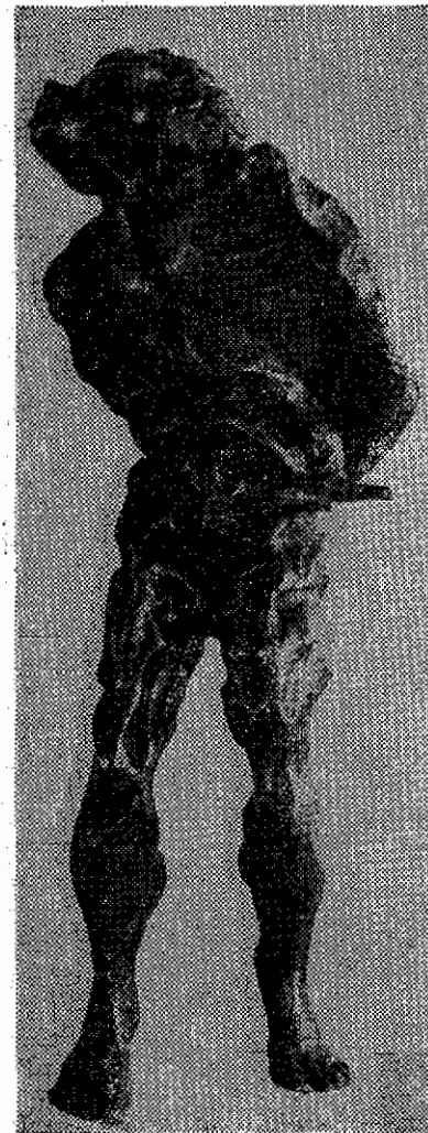
تندیس یادبود خسرو روزبه

مراسم پرده برداری از تندیس یاد بود خسرو روزبه صبح روز ۲۳ اکتبر (اول آبانماه) هیئت