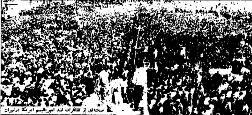
صحنه‌ای از قیامات ضد امپریالیسم آمریکا در تهران

پرچم بزرگ آمریکا در میدان، زیر گرمای خردادماه، افق را پرده کشیده است. پای پرچم تاجش کار می‌کند، سردم ایستاده‌اند. صدای پیچیده مردم این نفس ملتیب، از سراسر شهر در هم گره می‌خورد، فریاد می‌شود و در خیزش خود، ستاره های پرچم آمریکا، این ۵۳ ستاره‌ای را که در خون خلق های جهان متولد شده، از آسمان دروغین و حقوق بشره کارتر فرو می‌ریزد. چو آتی از کنار میدان می‌آید، سطل بزرگی در دست دارد، مردم کوجه راه می‌دهند، بعد از او جوان دیگری است، نردبانی همراه دارد می‌آید و کنار پرچم می‌ایستند، سرها و زنها هجومی آوردند و نردبام را بر پا نگاه می‌دارند.