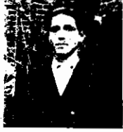
رفیق شهید علی بلندی