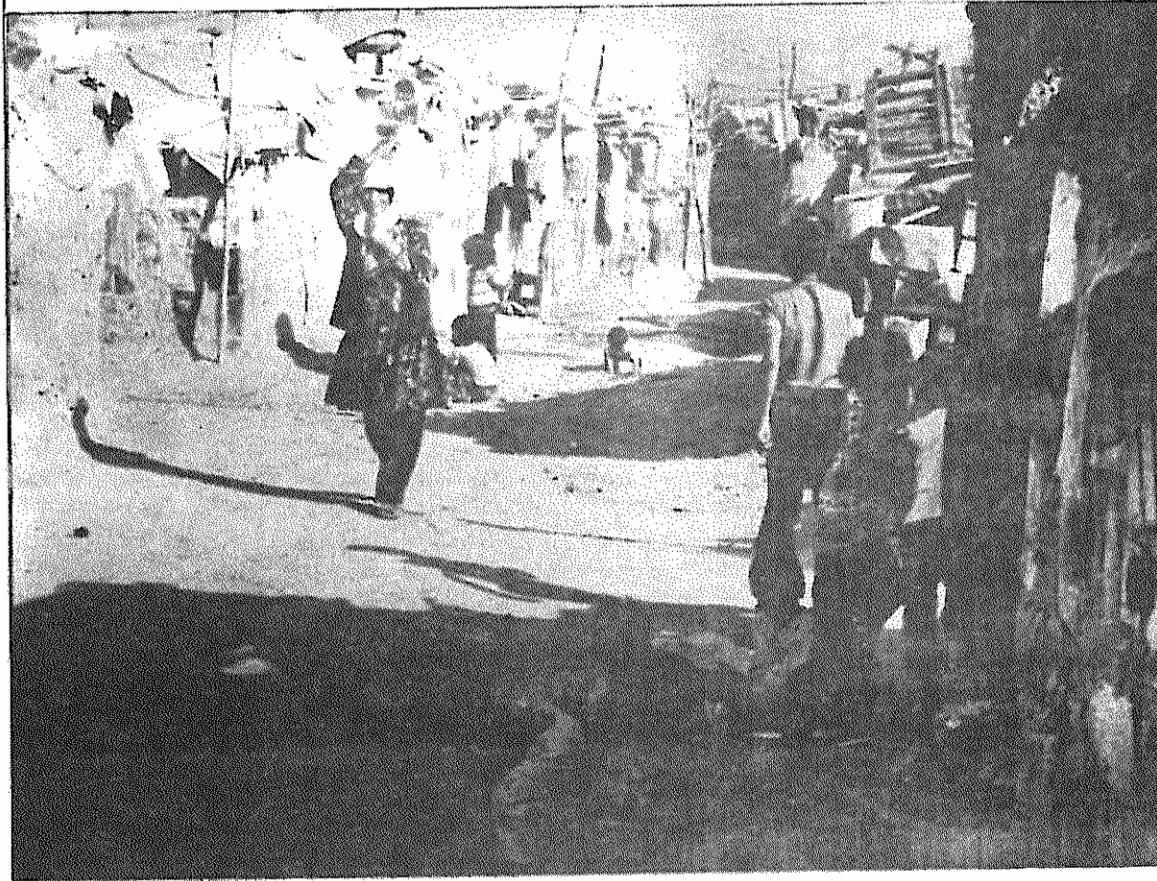
خانه هایی از گل و خشت و خاکی که از چند صد متر دورتر آب می آورد و بچه هایی که در خاک می لولند اینها گوشه ای از زندگی گودهاست. گوشه ای از تمدن بزرگ شاهانه! صفحه ۳

۴ هزار گود نشین: هیچ چیز نداریم! زمستان ها سیل وسط گودها جمع می شود و خانه ها را روی سرمان خراب می کند.