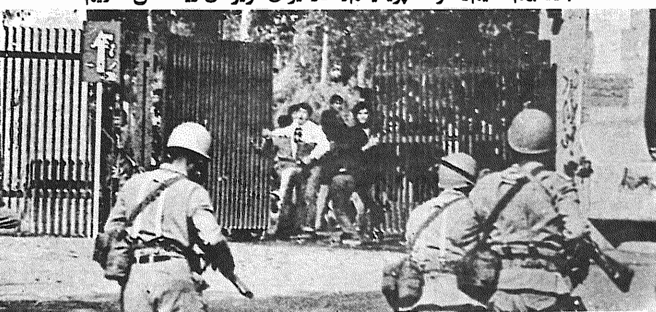
پلاکاردی که بمناسبت ۱۳ آبان، سالگرد شهادت دانش آموزان و دانشجویان، از طرف کانون دانش آموزان ایران انتشار یافته است و صحنه ای از هجوم نظامیان شاه جنایتکار را به دانشگاه نشان می دهد.

امروز سیزدهم آبان است. سال پیش، وقتی خورشید این روز در آسمان وطن ما طلوع کرد، زور و ستم هنوز حاکم بود. دشمن تا دندان مسلح خون می ریخت. پایه های تخت سلطنت برداری از خون میلرزید، اما هنوز خیال مقاومت ردا داشت. کوره انقلاب فروزان و امروز سیزدهم آبان مبارزه، چون اعتصاب و تحصن، به شکل عالیتر آن، یعنی قیام میدل میشد. فروزان تر میشد، اشکال ابتدائی مبارزه، چون اعتصاب و تحصن، به شکل عالیتر آن، یعنی قیام میدل میشد. صف متحد خلق، در کوره انقلاب آبدیده میشد و به بهای دادن هزاران شهید شور و هیاهو می گوناگون نبرد خیابانی را تجربه میکرد. سلاح توده ها مشت و سنگ بود و جنگ افسار دزد خیمان محدود را پهلوی، پیشرفته ترین سلاح های جهان سرمایه داری و آخرین وسائل ساخته شده برای مبارزه با خلقها در زرادخانه های آمریکا، انگلیس، فرانسه و آلمان غربی. در صف متحد خلق، جبهه اول نبرد، میلیونها سرباز بی باک از جوانان داشت. دانش آموزان، دانشجو جوانان، روحانیون و بازار ایران جوانان، بی باکانه صف دشمن میزدند، شهید میشدند و دشمن را در خون خود غرق میکردند. روز سیزدهم آبان ماه سال ۱۳۵۷ است. حوادث نوینی در جو انقلابی کشور بود. هر چه صف مردم متحدتر میشد، دشمن نیروی خویش را بیشتر بسیج میکرد. سیزدهم آبان، از نخستین ساعات روز، نبرد بی امانی در خیابانهای تهران با دشمنان شاه آغاز شد. و پیشاپیش رزمندگان خلقی، دانشجویان و دانش آموزان می-رزمیدند. ساعت ۹ صبح، در پیچ بقیه در صفحه ۲