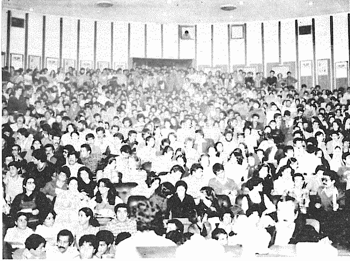
گوشه‌ای از اجتماع بزرگ کانون دانش آموزان ایران بمناسبت روز دانش آموز، سالگشت روز خونین ۱۳ آبان، در آمفی تاتر دانشکده فنی دانشگاه تهران

فرمودگان مرکزی حزب توده ایران نشانی: خیابان ۱۶ آذر - شماره ۶۸ تلفن: ۹۳۳۴۵۹ و ۹۳۵۷۲۸ چاپ، کلان