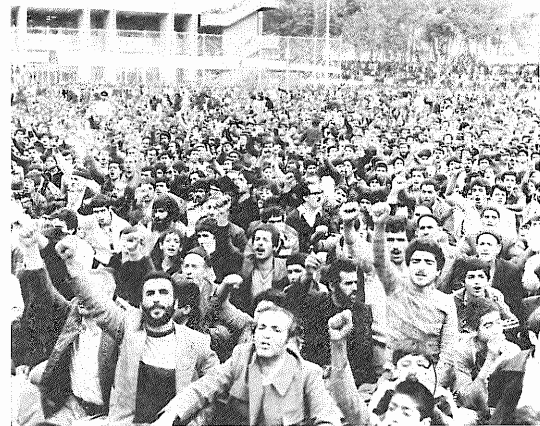
گوشه ای از مراسم ۱۳ آبان در زمین چمن دانشگاه تهران