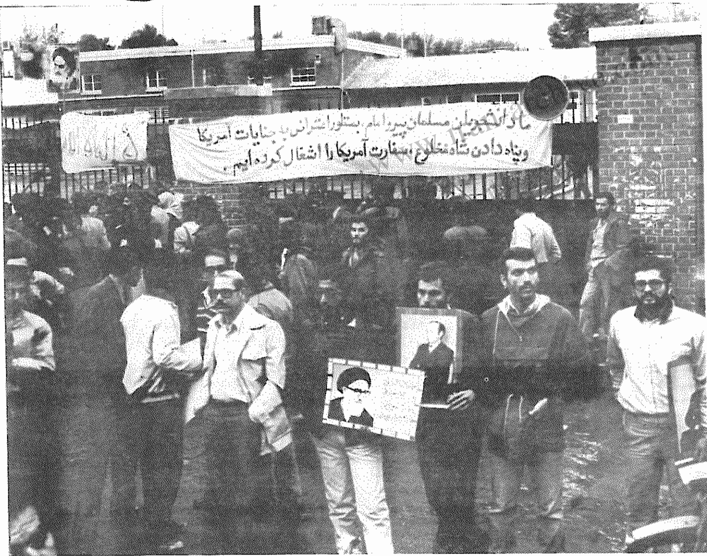
سفارت امریکا در اشغال دانشجویان پیرو امام خمینی - اشغال کنندگان در پلاکارد بزرگی که بر سر در سفارت نصب کرده اند، نوشته اند: «ما دانشجویان مسلمان پیرو امام، بمنظور اعتراض به جنایات امریکا و پناه دادن شاه مخلوع، سفارت امریکا را اشغال کرده ایم»

دانشجویان مسلمان پیرو امام خمینی: رابطه با امریکارا میخواهیم چه کنیم؟