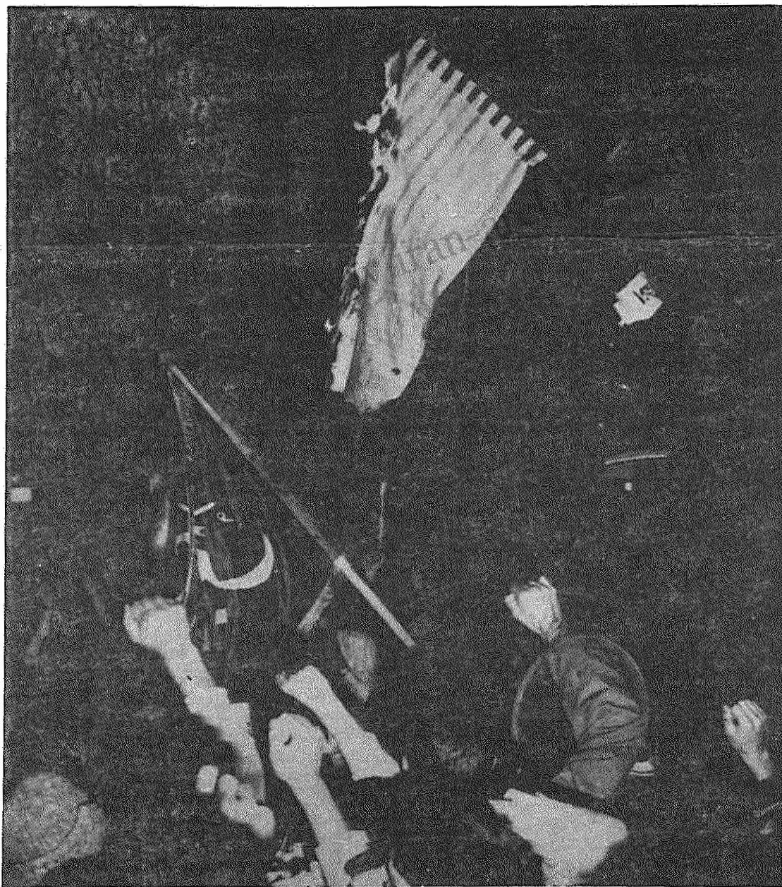
صحنه آتش زدن پرچم امریکا تکرار میشود