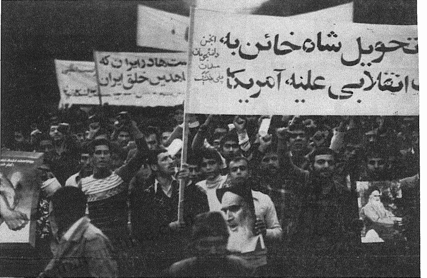
رود پر خروش جمعیت در تمام ساعات روز برای ابراز پشتیبانی از عمل انقلابی دانشجویان مسلمان پیرو امام، بسوی سفارت آمریکا، این مرکز بزرگ توطئه و جاسوسی، سرازیر است.

امریکا بازمیکند. اگر تحریرات امریکایی و هر گونه دامن زدن به تشنج و جنگ موجب بیم و نگرانی است، وضع کنونی بویژه در شرایطی که همه مردم ایران یکدل و یک زبان به نبرد علیه امریکاییسم امریکا برخاسته اند و خواستار برکنار کردن همه ریشه‌های ریش و سینه امریکا هستند و میروند تا انقلاب بزرگ مردم ایران را بر سرخوشی نوینی ارتقاء بخشند، امید به حل مسئله بیشتر و واقعی تر میشود. این امید اینک که اسام خدینی به هیات جنبش نیت فرمان ادا شده داده است، بیست و پنج پیش نبر و میگردد. امام خمینی رهبر انقلاب در پیام خود می گوید: «امید است در راه حال برادران کرد بطور شایسته فراهم شود.» این امید هسته طر فداران انقلاب و همه خواستاران حل در دست مسأله حاد موجود در کردستان است. این امید را شکوفان تر سازیم و به تحقق رسانیم.