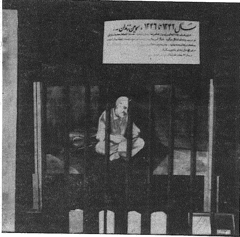
یکی از تصاویر نمایشگاه پدر طالقانی. این تصویر پدر طالقانی را در سومین باری که در سال ۱۳۴۶ بدست دژخیمان شاه دستگیر و به زندان انداخته شد، نشان می دهد.

عشق به طالقانی، عشق براه مردیست که تمامی زندگانی خود را برای پاره کردن زنجیر بردگان عصر ما ایثار نمود. همانظوری که کارمندان اداره متوفیات بدرستی در شناسنامه اوبجای مهر باطل شد طالقانی را در دست داشتند. برای عاشقان راه حقیقت، او همیشه زنده است. نمایشگاه انجمن دانشجویان مسلمان نیاز درونی هر ایرانی