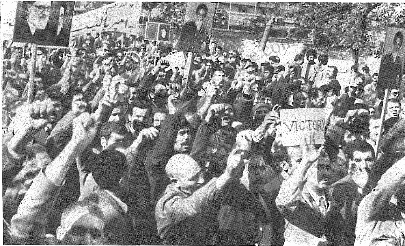
کارگران تهران آمادگی خود را برای مقابله با محاصره اقتصادی امپریالیسم آمریکا اعلام می‌دارند (صفحه ۶)