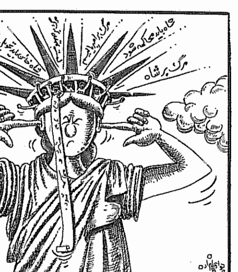
قتل از کیهان - ۲۲ آبان ۱۳۵۸

مردمی مومن به انقلاب دارند، امیدوار هستیم که شورای انقلاب با الهام از خواست‌های امام و توده‌های مستضعف، صمیمانه وسازگانه خود را آماده ایفای مسئولیت بزرگ خود سازد، بدیهی است که اگر شورا همچنان با ترکیب و پیشبرد عملکرد و مشی گذشته به کار خود ادامه دهد، بسا موقعیت روبرو نخواهد شد. از این رو اصلاح روش و ترکیب و نحوه عمل پیشین را باید دست لوجه دستور کار خود قرار دهد.