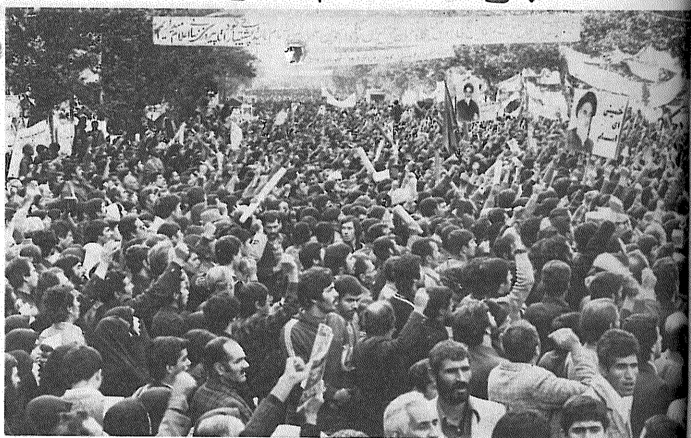
خشم خلق علیه امپریالیسم آمریکا و اراده خلق برای نابودی امپریالیسم آمریکا

آخرین دم برای نابودی امپریالیسم از برای نشینند. برادر فلسطینی از شوق به خود می پیچد. دستاثر ارتعاشی محسوس دارند. صدایش گویی در تمام جهان انعکاس می یابد، اوج می گیرد و بر تن امپریالیسم فرود می آید. امپریالیسم بر خود می لرزد، اینک خلق های محروم جهان بایکدیگر متحد می شوند. بعد از سخنرانی برادر فلسطینی جمعیت فریاد کتان سفارت آمریکا را پشت سر می نهند و شعار میدهند، آنها اینک میمانند که تا