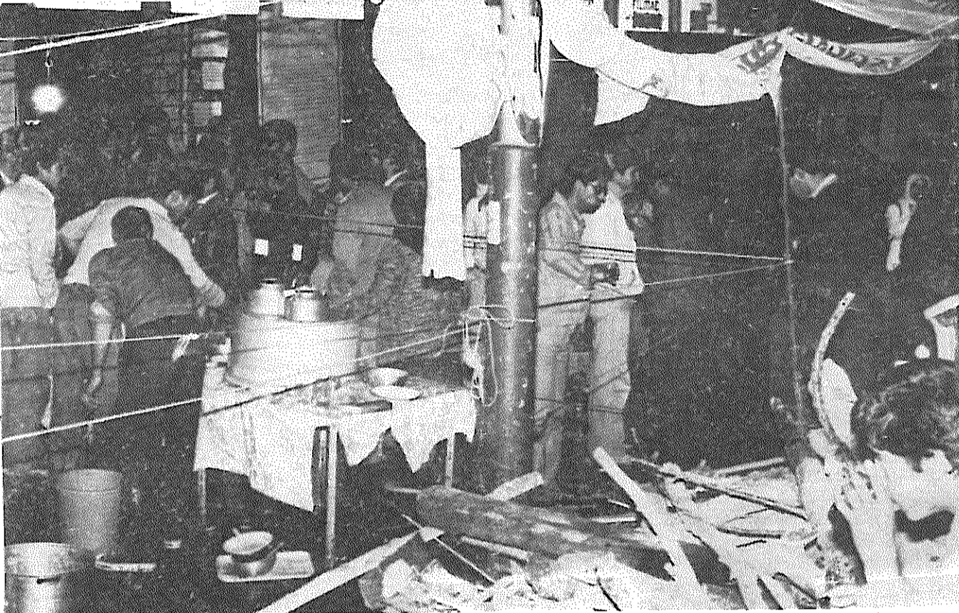
چای ضد امپریالیستی: نوش جان! به نابودی آمریکا!

شده اند، خودشان را می بینند، سال پیش همین موقع را می بینند، که در کار سرتکونی شاه بودند، یکی می گوید، سال دیگه این موقع باید فیلم مرگ آمریکا را نمایش بدهند، شب از همه که میگذرد، آنها که رفتی اند، میروند، انبوهی بر جامه ها اند، دسته دسته میشوند، کتیک می گذارند، آنها که نوبت خواب دارند، پتوهارا کنار خرمین های آتش می کشانند، کسی همزم می ریزد، کسی چای داغ می آورد، گروهی دراز می کشند، کفش جارا زیر سر می گذارند و بالالائی شمارهای ضد امپریالیستی بخواب میروند، تا ساعتی بعد بر خیزند و جای خود را بدیکری بدهند، درخیا بان رژه باشکوه ادامه دارد، این صدای سر و داد است، این صدای خلقی است، این شب ضد امپریالیستی است که میگذرد.