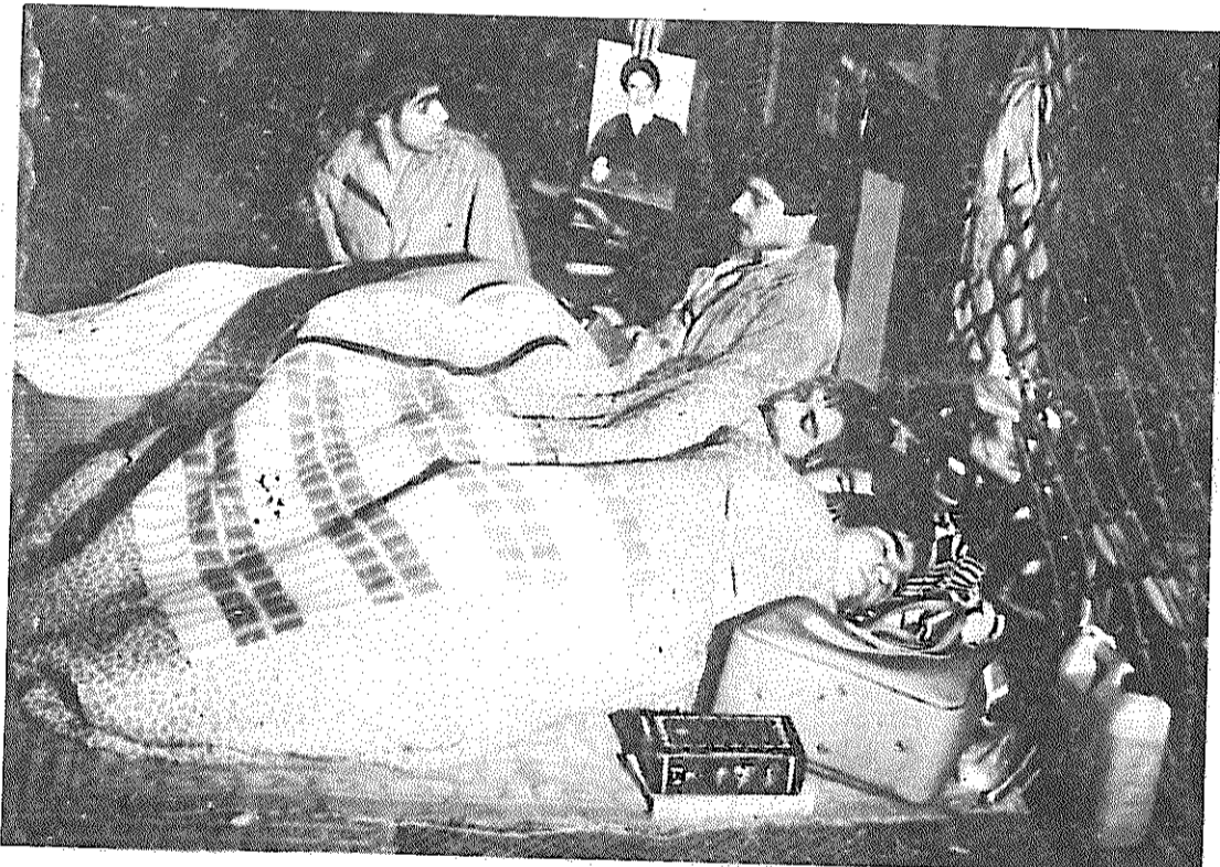
پاران انقلابی، شب را در مقابل جاسوسخانه دشمن سحرمی کنند. از این شب خفتگان بیدار بسپارند.

نام نویسی در حزب توده ایران کارگران و زحمتکشان هوادار حزب توده ایران که میبایست در حزب ثبت نام کنند، ولی در ایام هفته فرصت اینکار را ندارند، میتوانند روزهای جمعه از ساعت ۹ تا ۱۱ صبح و از ۵ تا ۷ بعد از ظهر به دبیرخانه کمیته مرکزی حزب توده ایران، واقع در خیابان ۱۶ آذر، ضلع غربی دانشگاه تهران، مراجعه کنند.