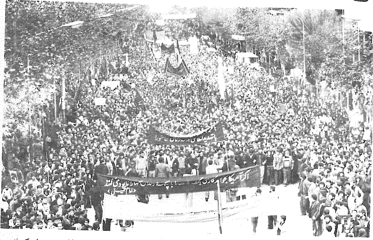
مردم در روزهای تاسوعا و عاشورا برای ادامه مبارزه علیه امپریالیسم آمریکا تجدید پیمان کردند...