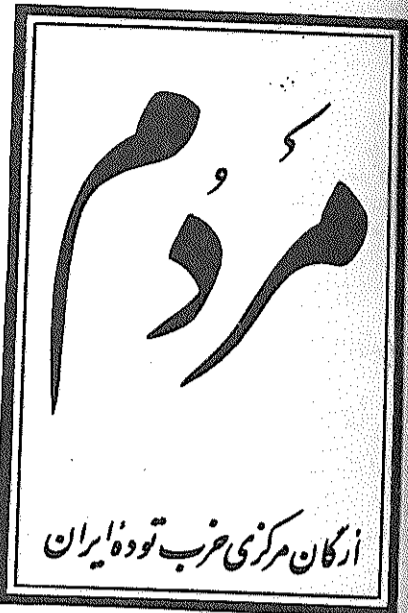
ارگان مرکزی حزب توده ایران

توصیه امام را برای وحدت بپذیریم و در تحقق آن بکوشیم بقیه در صفحه ۸