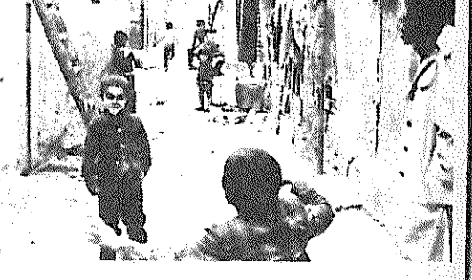
گزارشی از زندگی سربا محرومیت گروهی از هموطنان ما، در قلب پایتخت...