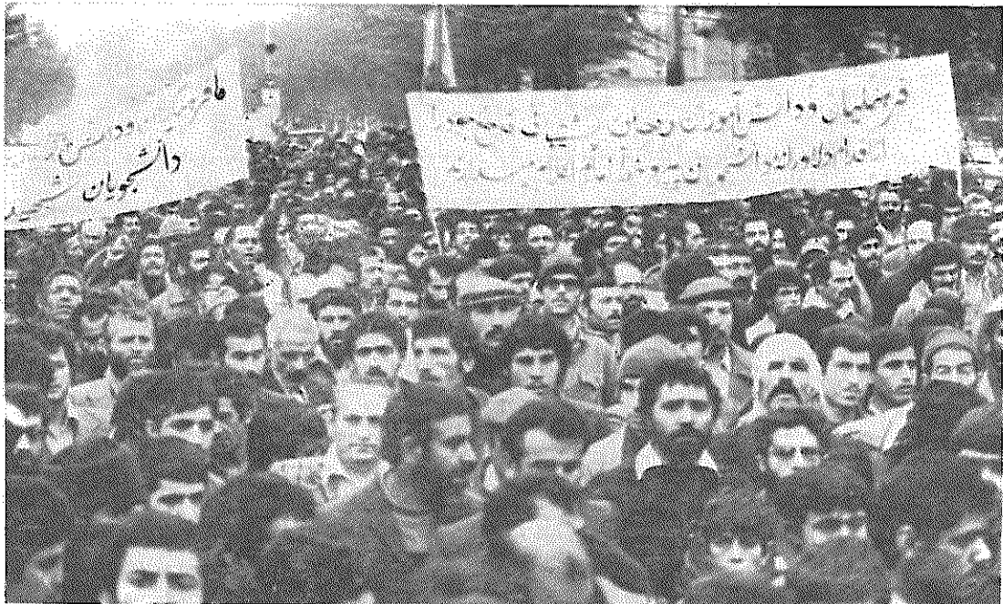
صدها هزار نفر از مردم تهران از راه پیمایان ضد امپریالیسم که دیروز وارد پایتخت شدند، استقبال کردند