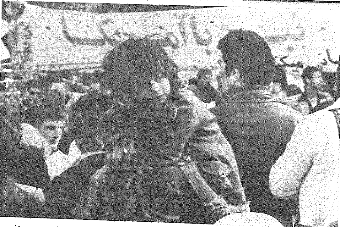
نبرد با امریکا، این دشمن اصلی خلق های ایران و جهان، در سراسر کشور ادامه دارد. همه روزه، گروه های بازم بیشتر از مردم مبارز وطن ما، از اکناف کشور، خود را به تهران می رسانند و در برابر جاسوسخانه امریکا، دیدارهای باشکوهی با هم دارند.

باید همواره در نظر داشت که خلق کرد و نیز رهبری انقلاب، خواستی جز اتحاد برابر حقوق خلقها ندارند