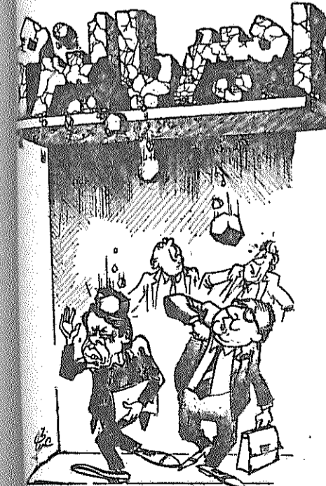
افول امپریالیسم... (کیهان، ۱۷ آذر)

Price: West - Germany 0.80 DM France 1.30 fr Austria 8 sch. England 20 P. Belgium 10 fr. Italy 350 L. USA 50 Cts.