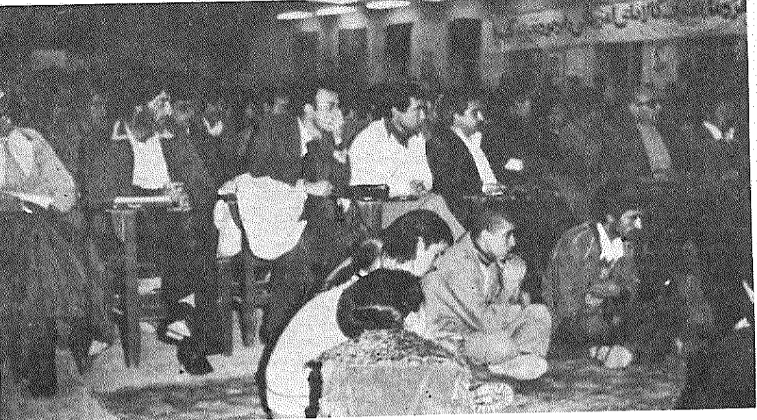
گوشه‌ای از مراسم یادبود شهدای ۱۶ آذر در اراک

ما از مقامات مسئول و بویژه هیئت ویژه کردستان نیمی طلبیم که جلوی این تحریکات را، که هدفی جز عقیم گذاشتن مذاکرات کردستان و جلوگیری از حل مسالمت آمیز مسئله کردستان ندارد، با قاطمیت بگیرند.