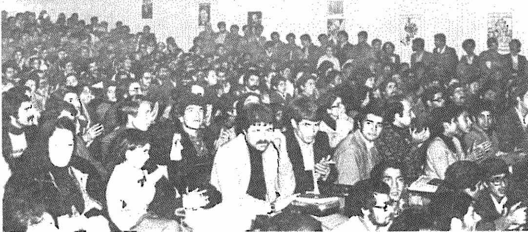
گوشه ای از مراسم یادبود شهیدان ۱۶ آذر در مشهد

کارخانه قند کرج در نزدیکی کرج واقع شده است. این کارخانه قبلا متعلق به هژیرزدانی بود، که در زمان انقلاب دستگیر شد، ولی پس از مدتی آزاد گردید و به خارج گریخت . در حال حاضر کارخانه با بودجه و سرمایه گذاری دولت کار میکند و روزانه ۱۵۰۰۰۰ کسه شکر، هر کسه ۱۰۰ کله، تولید