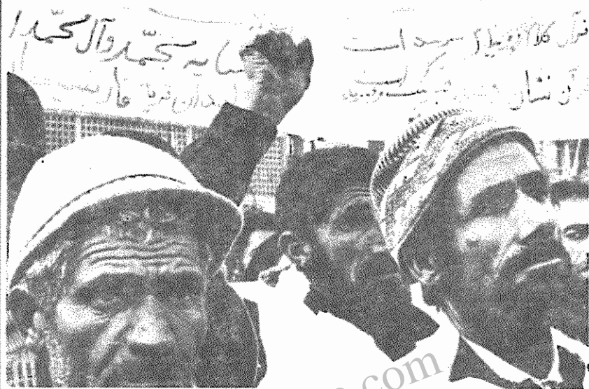
این چهره رنج دیده و خشمگین دهقانان فارسیمجان فراهان اراک است، فریاد می زنند: صد ها هزار کشته، صد ها هزار زخمی، دیگر نباید سازش ...