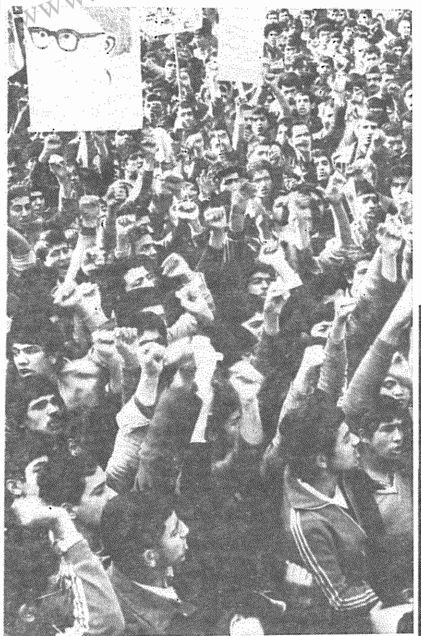
این صف عظیم دانش آموزان است. دانش آموزان مدرسه راهنمایی ودیرستان سنایی (ناحیه ۵) با مشت های گره کرده آمریکا را محکوم می کنند.

با حضور صفوف دهقانان، جوانان، دانش آموزان، در مقابل لانه جاسوسی: