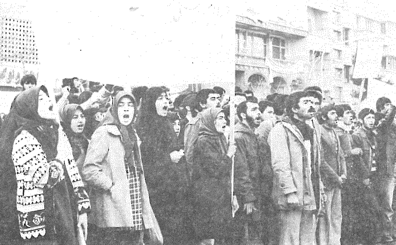
دانشجویان دانشگاه مشکین فام ساری، دیروز، در کنار سایر طبقات مردم، روز باشکوه و غرور انگیزی را در برابر جاسوسخانه آمریکا بوجود آوردند.

مقاومتش در برابر خواستهای ملت خشم و نفرت مردم را هر چه بیشتر برمی انگیزد. هر لحظه مردم با قدرت بیشتری بسیج می شوند. خود را آماده می سازند تا عامل سالهای اسارت و بدبختیشان را یکجا یکپور بپارند. بسیج می شوند تا برای امپریالیسم گورستانی بسازند. متحد میشوند تا دست در دست هم پایه های یکدیگر بنائند و نوبت بسازند و امپریالیسم را در این نقطه از جهان به ابدیت بپارند.