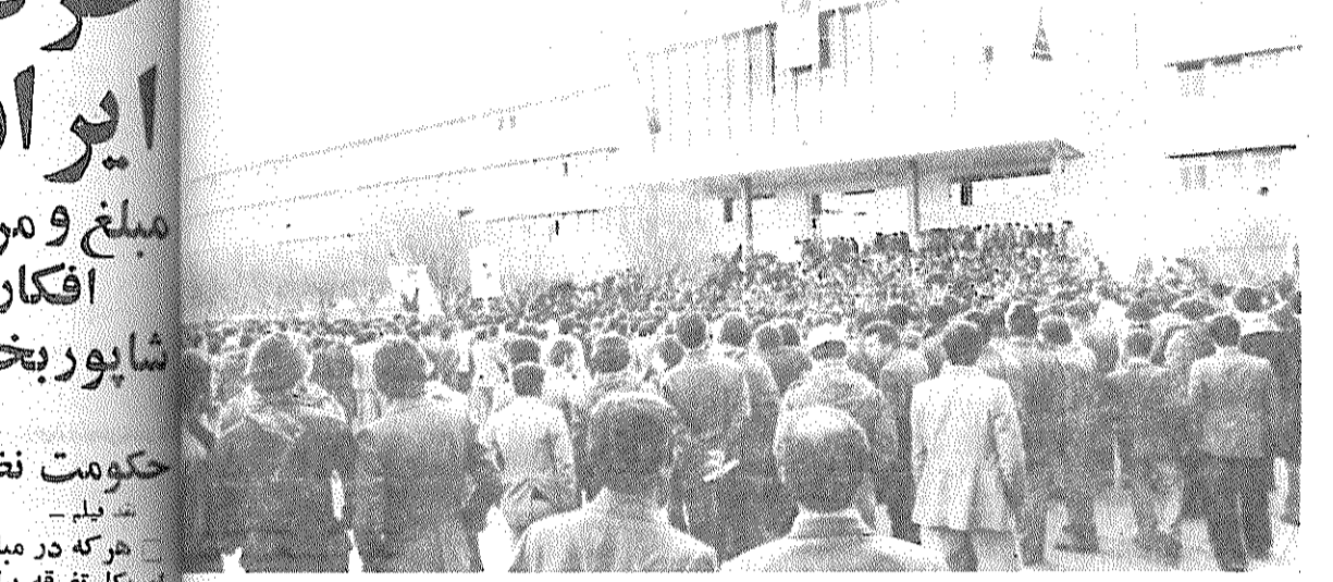
مردم تبریز در اجتماع عظیم روز چهارشنبه در محوطه دانشگاه، امپریالیسم آمریکا را محکوم کردند

از آقا پشتیبانی کرد... ما هم آمده ایم، او در مورد امام خمینی می گوید: «خمینی رهبر راست، او شاه را بیرون کرده، او رهبر مسلمانان است. آقا مرجع است. روستائی دیگری که کنار حمزه قدم بر می دارد، وقتی حرف آمریکا پیش می آید، اخم هایش را درهم می کند و می گوید: «آمریکا جنایت کرده، از شاه حمایت کرده. امام خمینی که شاه را بیرون کرده، حالا جلوی آمریکا ایستاده. دست خدا به همراهش». در کنار روستائیان، بچه های کوچک دبستانی گام بر می دارند. بعضی معلم ها و مدیرها مدارس را تعطیل کرده اند. به بچه ها گفته اند: