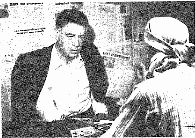
روایرولنی دوجهان در مخفیگاه چریکها... این چهره مغرور سر جاسوس آمریکاست که در این فیلم «قهرمان» معرفی میشود.

گروه ضربت، بخش ویژه و اعتراف دنبال کرد. این فیلم آخر آنچنان ضد کمونیستی بود که حزب کمونیست فرانسه آنرا تحریم کرد.