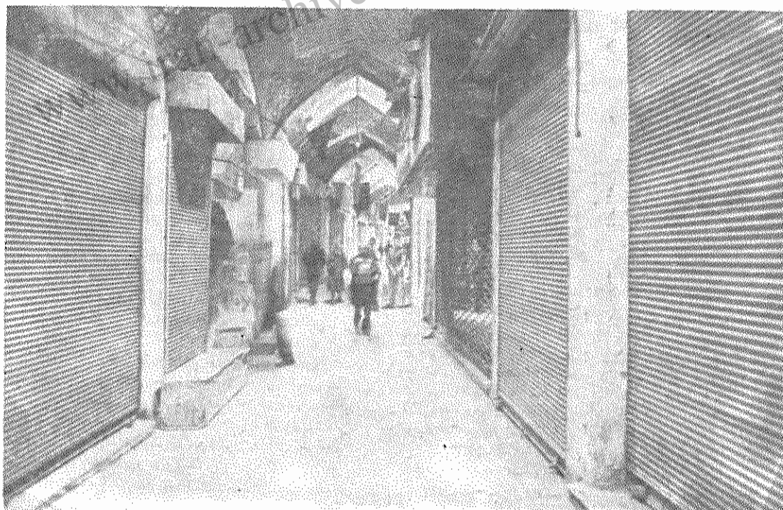
دیرور - نخستین روز تعطیل - بازار تبریز یکپارچه تعطیل بود.

شش هزار نفر از اعضای حزب جمهوری خلق مسلمان در اردبیل از این حزب کناره گیری کردند