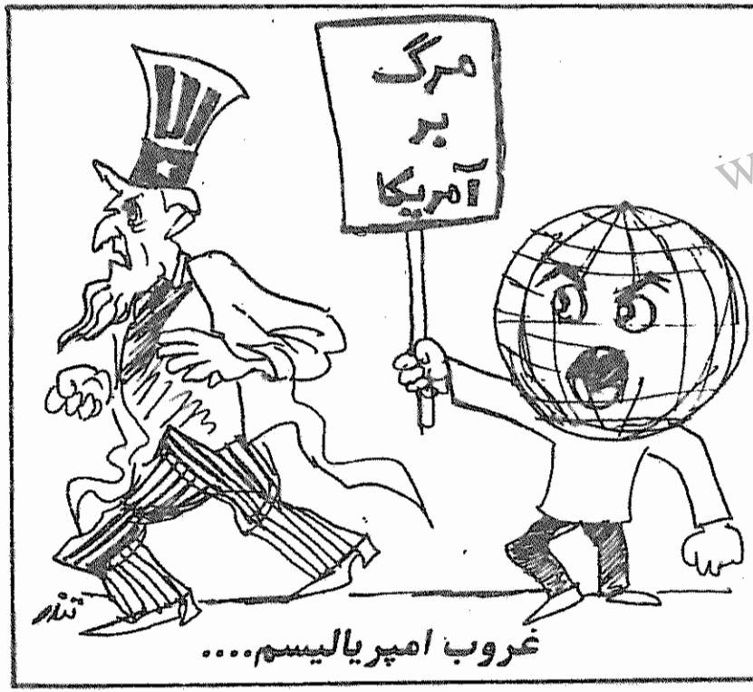
کیهان، ۲۶ آذر ۱۳۵۸

وقت ملاقات شده است از سندیکاهای کارگری شمال کشور از جمله سندیکاهای پخش تهران، سندیکای اکتشاف و استخراج، تیریز، قزوین و مستند در خواست سندیکای خطوط لوله زنجان، سندیکای بازرگانی ری، سندیکای ادارات مرکزی شرکت ملی گاز و سندیکای پخش کرمانشاه.