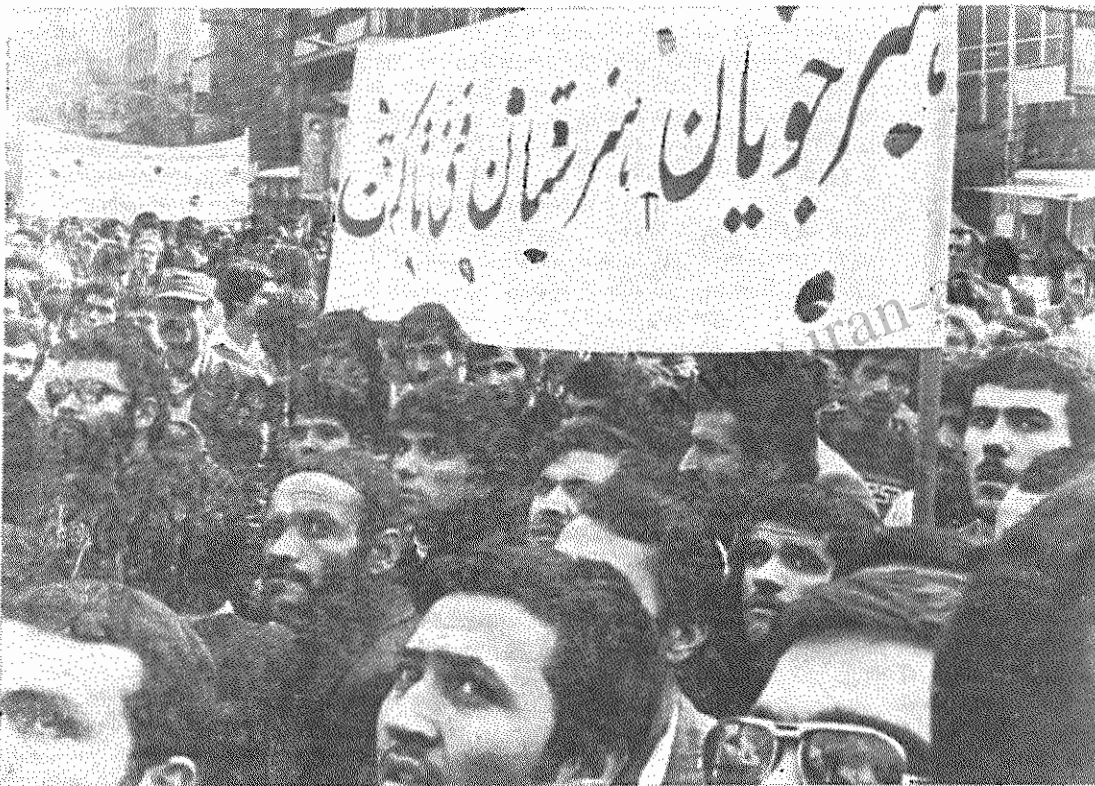
هنرجویان دبیرستان فنی تاستان، بعد از ۶ روز راهپیمائی به مقابل لانه جاسوسی آمریکا رسیدند و نفرت خود را نثار امپریالیسم آمریکا کردند.

دیروز لانه جاسوسی آمریکا بار دیگر شاهد احساسات ضد امپریالیستی مردم ما بود.