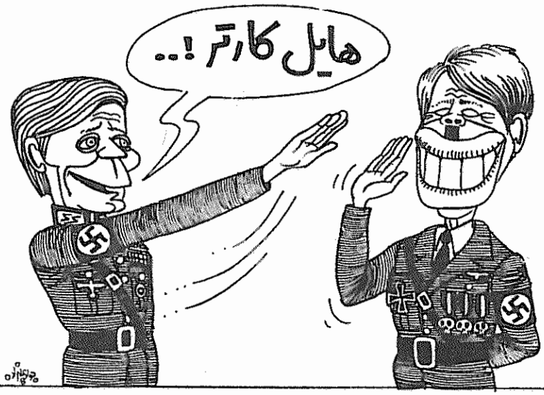
کیهان - ۱۳۵۸ آذر ۲۸

بکنند. چرا شما با تودهها تماس نمی گیرید. امروز باید هوشیار بود که رفرمیستها را کنار بگذارند