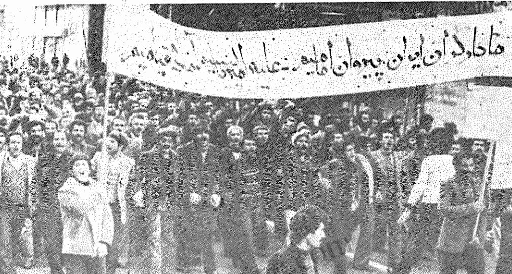
دیروز طبقه کارگر مبارز و قهرمان ایران بر پشتیبانی خود از امام خمینی، رهبر انقلاب ایران، تأکید کرد