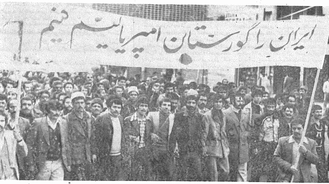
دیروز طبقه کارگر مبارز و قهرمان ایران آمادگی خود را برای اینکه امپریالیسم را در ایران به‌گور بسپارد، اعلام داشت

دیروز جلوی جاسوسخانه امریکا میعادگاه کارگران مبارز و قهرمان ایران بود، که یکصد نفر یاد میزدند: