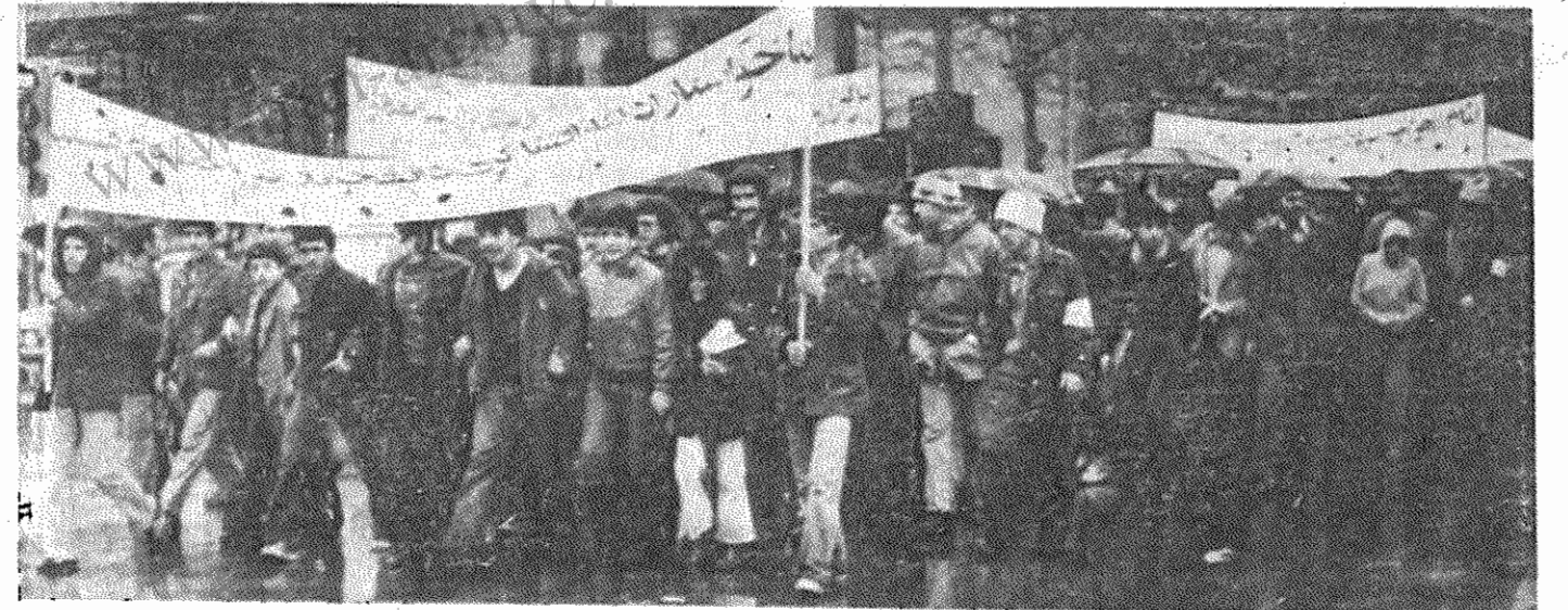
نوجوانان ما، که در انقلاب بزرگ خلق ما شرکت فعال داشته اند، اینک آماده دفاع از انقلاب اند