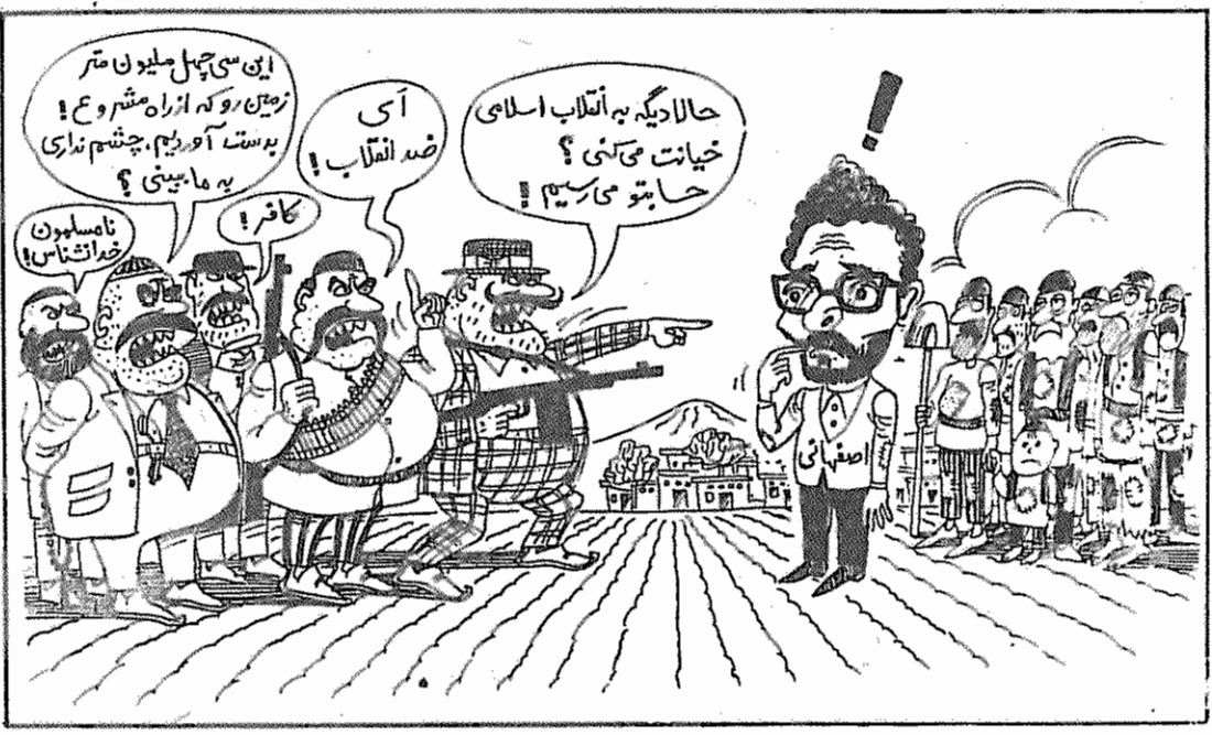
کیهان - دوم ماه ۱۳۵۸

اقتصاد و فرهنگ که پایه‌های بنیادی هستند باید بطور انقلابی تحول یابند وقتی زمین مال کشاورز باشد و ده به بازار سپر راه داشته باشد و فروش محصول کشاورز صرف کند، روستایی ناگزیر به ده باز خواهد گشت، چرا که دیگر سرمایه‌او را سلفخر و نژولخواز نمی‌بلد و بانک بازاری مدکار آورد آباد کردن آبادی اوست. وقتی کارگر در اداره و تولید درآمد کارخانه سپیم باشد کارگر بیشتر و در آمدش بهمان نسبت افزونتر میشود و این حالت که بدون کار درآمدی حاصل شود از سطح جامعه محرومی ما رخت بر خواهد بست و کار تقسیم خود را در ادامه حیات باز خواهد یافت. حذف بهره‌ملی کردن تجارت خارجی، تصحیح سیستم بانکی، اصلاحات ارضی، برقراری نظام شورایی خودگردانی اقوام ایرانی و استقرار عدالت اجتماعی و رفاه و گسترش فرهنگ و آموزش و... در ارتباطی بنیادی با یکدیگر که در مجموع یک نظام اجتماعی را تشکیل میدهند. اقتصاد و فرهنگ پایه‌های اساسی تحول جامعه‌اند و نهادهای دیگر در رابطه متقابل با آن وجود و حرکت می‌یابند پس بدون توجه به دینوباد فرهنگ و اقتصاد، جامعه تحولی نمی‌یابد که مبارزه واقعی ضد امپریالیستی در آن تصیق یابد و این شیوه او قاطع در محو استعمار کاری افتد. برای استقلال کشور خود به حکومت انقلابی اعتماد کنیم با انتقاد سازنده آنرا از اشتباهاتش آگاه کنیم و بخواهیم که حکومت عدالت و آزادی را که سرچشمه اعتماد ملت بدولت است از توده دریغ ندارد. (اطلاعات، ۵ دی)