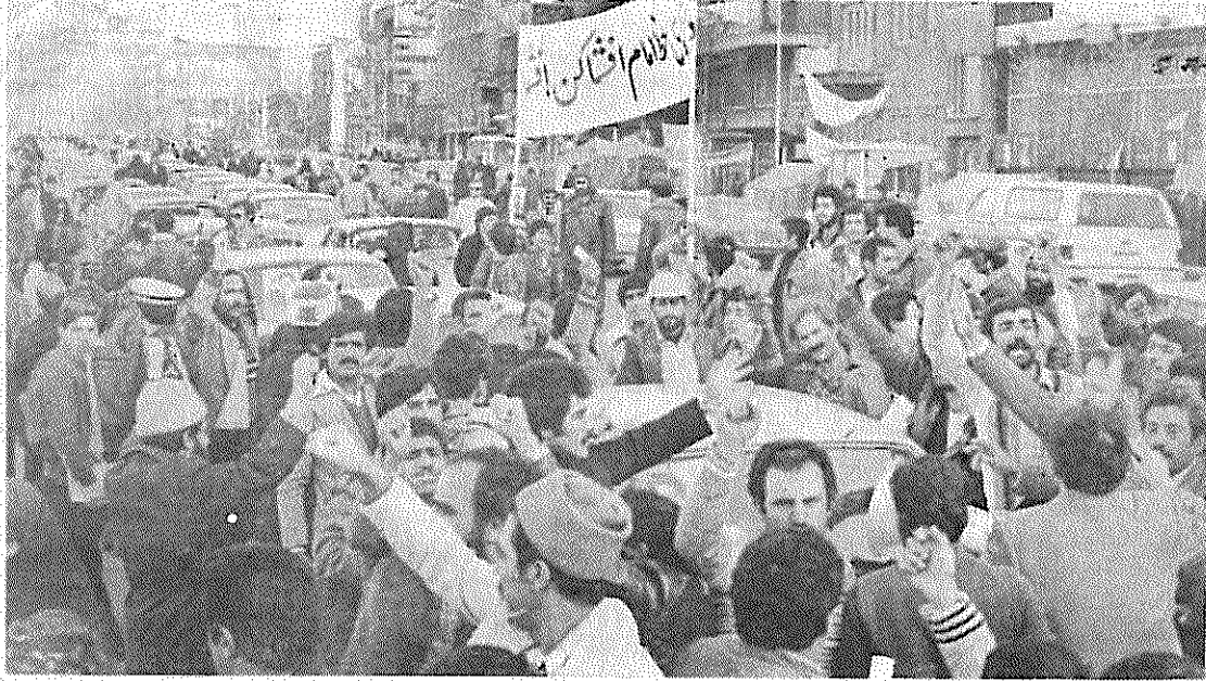
تاسی رانان زحمتکش در تظاهرات حدود در برابر حاسوسخانه آمریکا توطئه ضد انقلاب را در قم و تبریز محکوم کردند.

آیا مردم تبریز حق ندارند از مقامات اجرائی شهر بپرسند چرا دستورهای مکرر دادستان انقلاب و دیگر مقامات مربوطه در باره بقیه در صفحه ۲