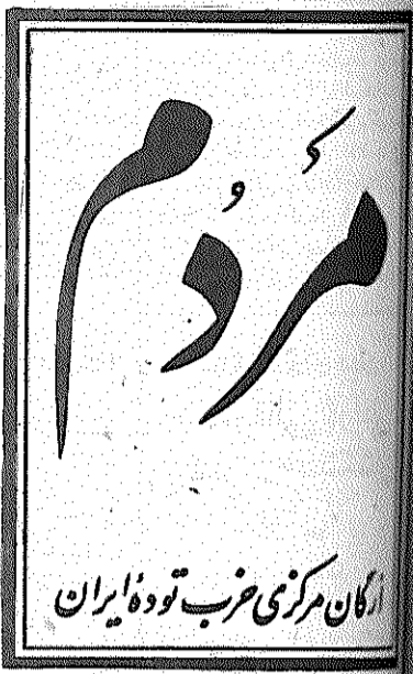
ارگان مرکزی حزب توده ایران

از روز ۴ دیماه که «دانشجویان مسلمان پیر و خط امام» طی انتشار اسنادی، سیاست سازشکارانه و مخالف انقلاب و استبداد بورژوازی لیبرال را آشکار ساختند، اقدامات افشاگرانه آنها متوقف گردیده است. فردای آنروز دانشجویان طی انتشار اعلامیه ای خاطر نشان ساختند که، تنها در صورت تأیید مردم، افشاگریهای خود را ادامه خواهند داد. و مردم تأیید کردند. از آنروز جاسوسخانه امریالیسم آمریکا میدگاه خلقی بوده است که نه تنها خرسندی خود را از افشای خائنین به منافع مردم و سازشکاران اعلام میدارد، بلکه همچنین قاطعانه خواستار ادامه این افشاگریها، کشودن مشت ریاکاران نوکسانی میشود که بنام حمایت از انقلاب، ناچوانمرانه آنرا از پشت باخچه های سازش و خیانت مورد حمله قرار میدهند و خواستهای مردم انقلابی را برای ارضاء مطامع ناسالم خویش به مرض بیع و شرا می گذارند. از ۴ دیماه تاکنون، تقریباً تمامی احزاب، سازمانها و گروههای انقلابی و علاقمند به سرنگشتن انقلاب ضد امریالیستی و خلقی کشورما، با انتشار اعلامیه های خواست ادامه افشاگری پشتیبانی کرده اند. شورای انقلاب اسلامی نیز در روز ۲۰ دیماه، طی اعلامیه ای، افشاگریها را ضرورت انقلاب شمرد. باقیه در صفحه ۲