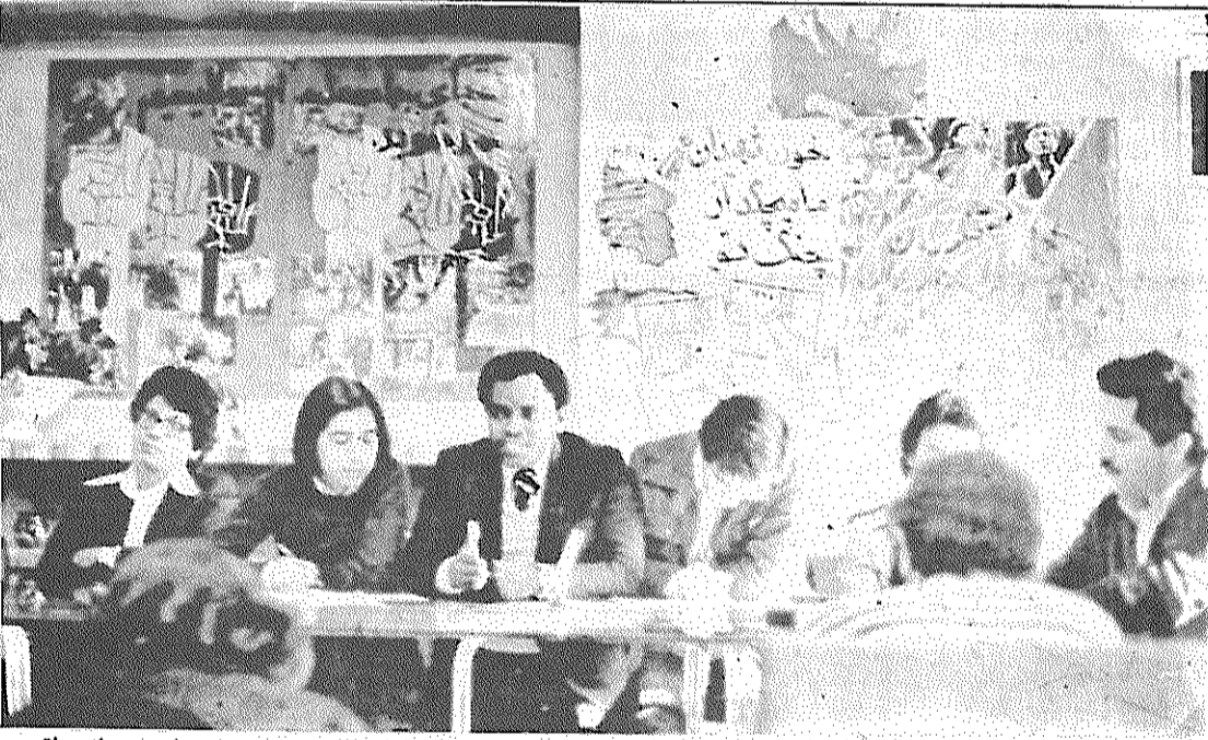
نمایندگان فدراسیون دانشجویان پاناما (اتحادیه ملی) در مصاحبه مطبوعاتی

روز رادیو مسکو در خود زیر عنوان «اتحاد شوروی با تعیین مجازات های اقتصادی در مورد ایران مخالف است» روزنامه «مردم» در مقاله ای با عنوان «اتحاد شوروی با تعیین مجازات های اقتصادی در مورد ایران مخالف است» روزنامه «مردم» در مقاله ای با عنوان «اتحاد شوروی با تعیین مجازات های اقتصادی در مورد ایران مخالف است» روزنامه «مردم» در مقاله ای با عنوان «اتحاد شوروی با تعیین مجازات های اقتصادی در مورد ایران مخالف است»