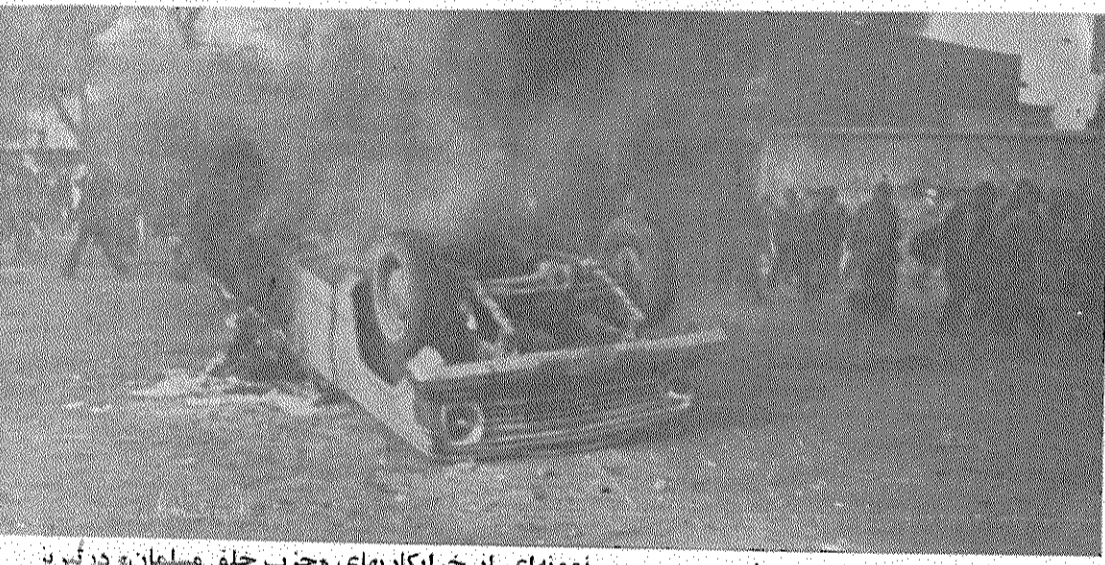
نمونه‌ای از خرابکاریهای «حزب خلق مسلمان» در تبریز