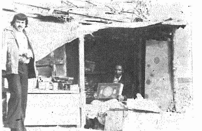
این بساط زندگی چند نفر را باید تامین کند.