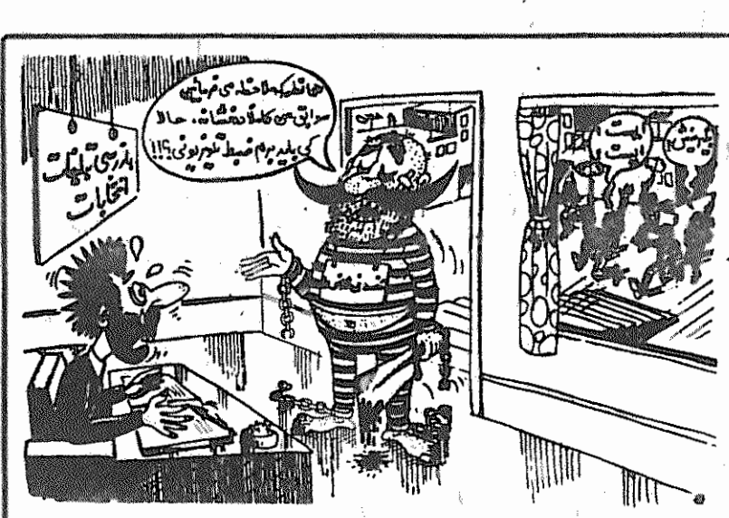
(کیهان، ۲۳ دی)

یکی از نامزدهای ریاست جمهوری زندانی شد یکی از نامزدهای ریاست جمهوری بنام ابراهیم میرزائی به زندان تحویل داده شد. ظاهراً علت زندانی شدن وی همکاری با رژیم گذشته است. (جمهوری اسلامی، ۲۴ دی) ابراهیم میرزائی از شاه سابق اسلحه کموی جایزه گرفته بود یکی از اعضاء دادگاه انقلاب امروز در گفتگویی با کیهان در مورد دستگیری ابراهیم میرزائی، یکی از کاندیداهای ریاست جمهوری، گفت: «دیروز بدنبال جلسه کمیسیون نظارت بر تبلیغات انتخابات ریاست جمهوری، ابراهیم میرزائی که منم به همکاری با رژیم گذشته و ساواک می باشد، با حکم دادستانی دستگیر زندانی شد.» وی همچنین افزود که بدنبال پیروزی انقلاب یکبار دیگر ابراهیم میرزائی به اتهامات گوناگون دستگیر شده که در جریان دستگیری نیز مجروح گردید و مدتی نیز در دادستانی انقلاب بازداشت بوده است. وی افزود که کاندیدایی ایشان برای ریاست جمهوری ایران مسلماً یک توطئه بر علیه انقلاب اسلامی و جمهوری اسلامی ایران بوده است، چرا که وی حتی به خاطر همکاری با رژیم گذشته از شاه سابق نیز یک اسلحه کمری جایزه گرفته که مدارک آن نیز در دادستانی موجود است. (کیهان، ۲۴ دی)