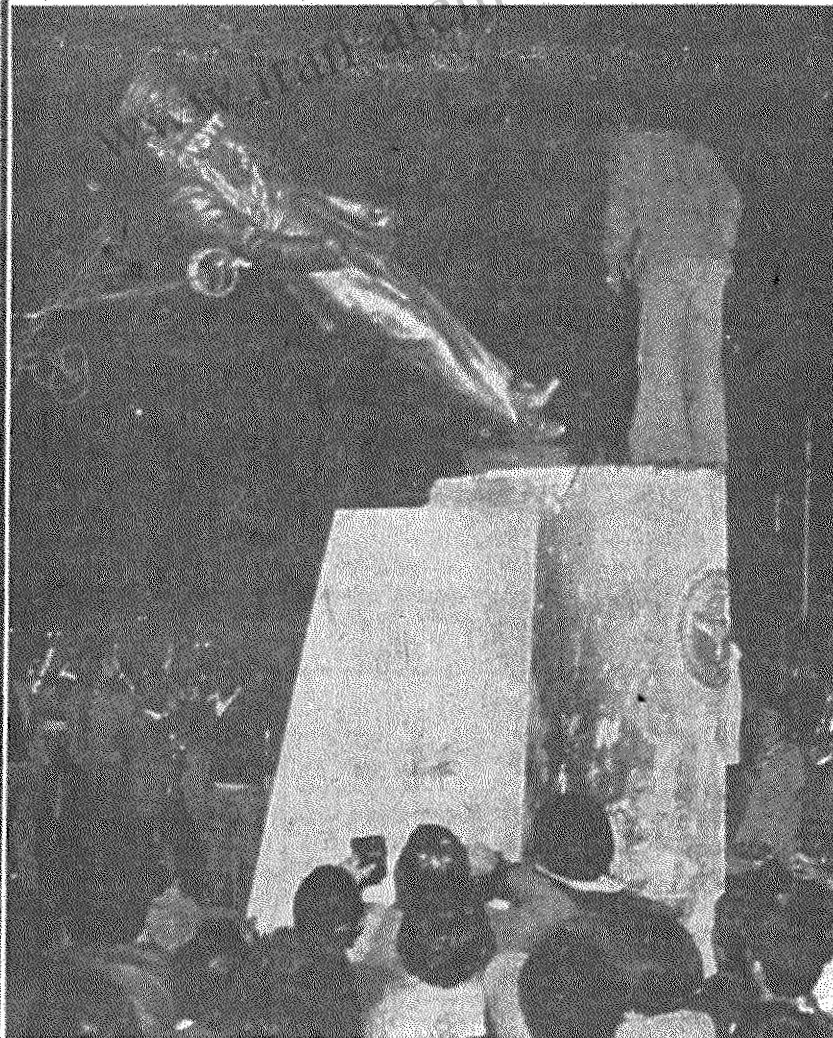
مردم مجسمه طاغوت را به زیر می‌کشند

مردم در جشن عظیم خود بعد از فرار شاه‌خان فریاد می‌زدند: بعد از شاه، نوبت آمریکاست