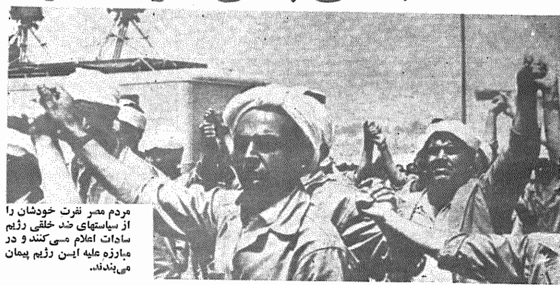
مردم مصر نفرت خودشان را از سیاستهای ضد خلقی رژیم سادات اعلام می‌کنند و در مبارزه علیه این رژیم پیمان می‌بندند.

روزیهای ۱۸ و ۱۹ ژانویه (۲۸ و ۲۹ دیماه) روز همبستگی جهانی با مردم مصر و ابراز نفرت مردم آزادیخواه جهان علیه سیاستهای ضد خلقی رژیم سادات است. بر وایستگی اقتصاد مصر به اقتصاد امپریالیسم می‌افزود و تمامی دستاوردهای انقلاب مصر و حکومت مرقی عبدالناصر را پایمال ساخته و کشور را عرصه جولانگاه بورژوازی وابسته و دلاصفت و غارتگریهای پر حساب امپریالیسم آمریکا ساخته بود، برای تحمیل بار بحران ناشی از سیاستهای اقتصادی ضد خلقی خود بر دوش زحمتکشان مصر، بهای مواد غذایی را بشدت افزایش داد. توده‌های مردم مصرف‌رای آرزو بعنوان اعتراض به این عمل خائانه، به خیابانها ریختند. پس از دو روز تظاهرات خشم‌آگین میلیونی مردم، رژیم سادات مجبور به عقب‌نشینی شد. رژیم دست‌نشانده سادات در این دو روز، مردم را بشدت سرکوب کرد. دهها نفر کشته، هزارها نفر مجروح و قریب ۴ هزار تن از مبارزان مصری دستگیر و زندانی شدند، که هنوز پس از ۳ سال بسیاری از آنها در زندانها باقی مانده‌اند. در میان شخصیتهای برجسته مبارزی که بازداشت شدند، از